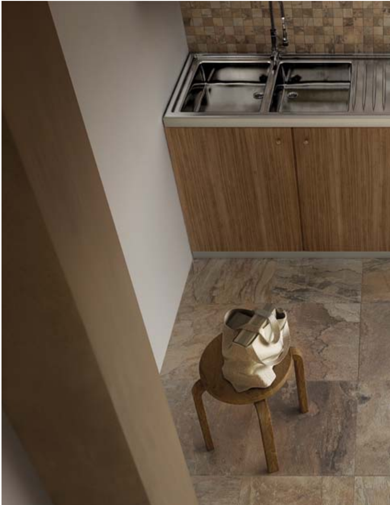
CP47769 Slate Multicolor Beige 45x45 CP47781 Slate Multicolor Beige Mosaic 5x5 - 30x30