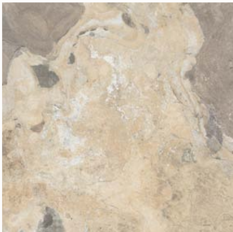
slate multicolor beige