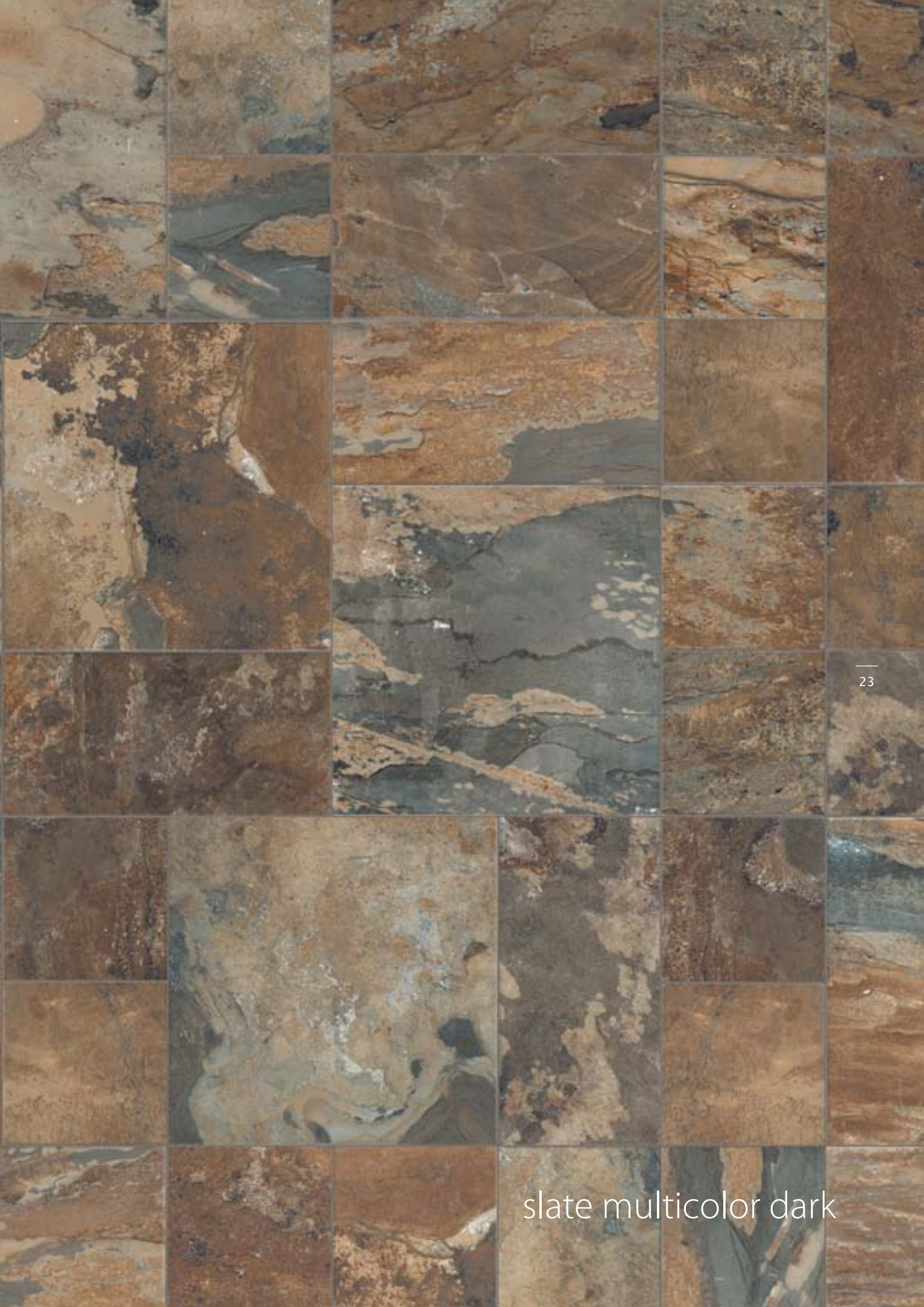
slate multicolor dark