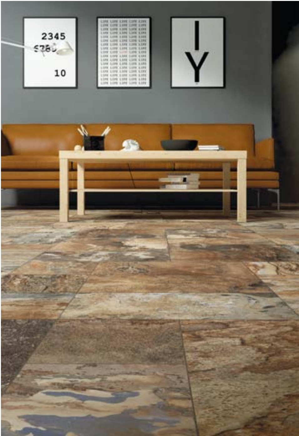
CP47768 Slate Multicolor Dark 45x45 CP47820 Slate Multicolor Dark 22,5x45 CP47817 Slate Multicolor Dark 22,5x22,5