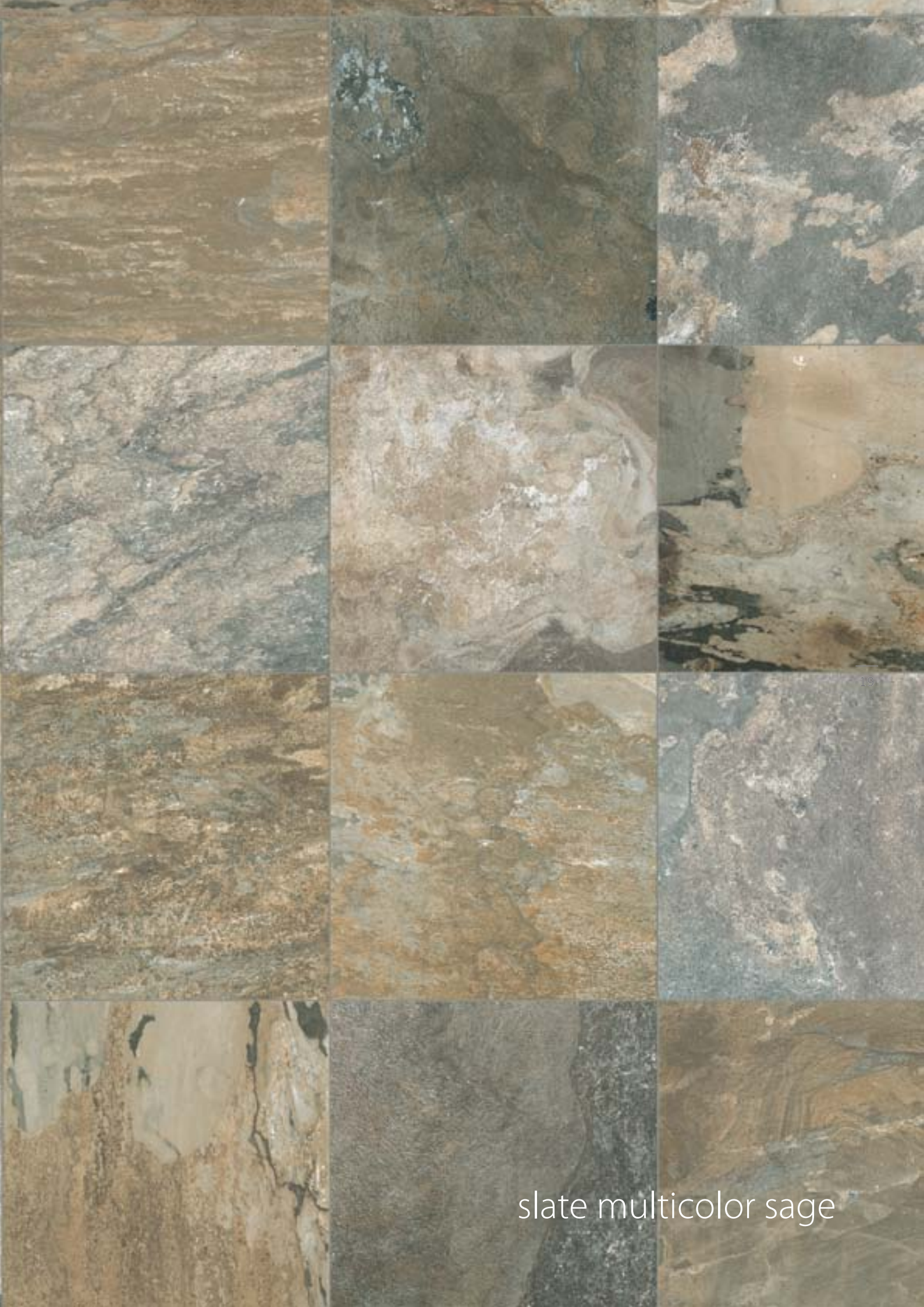
slate multicolor sage