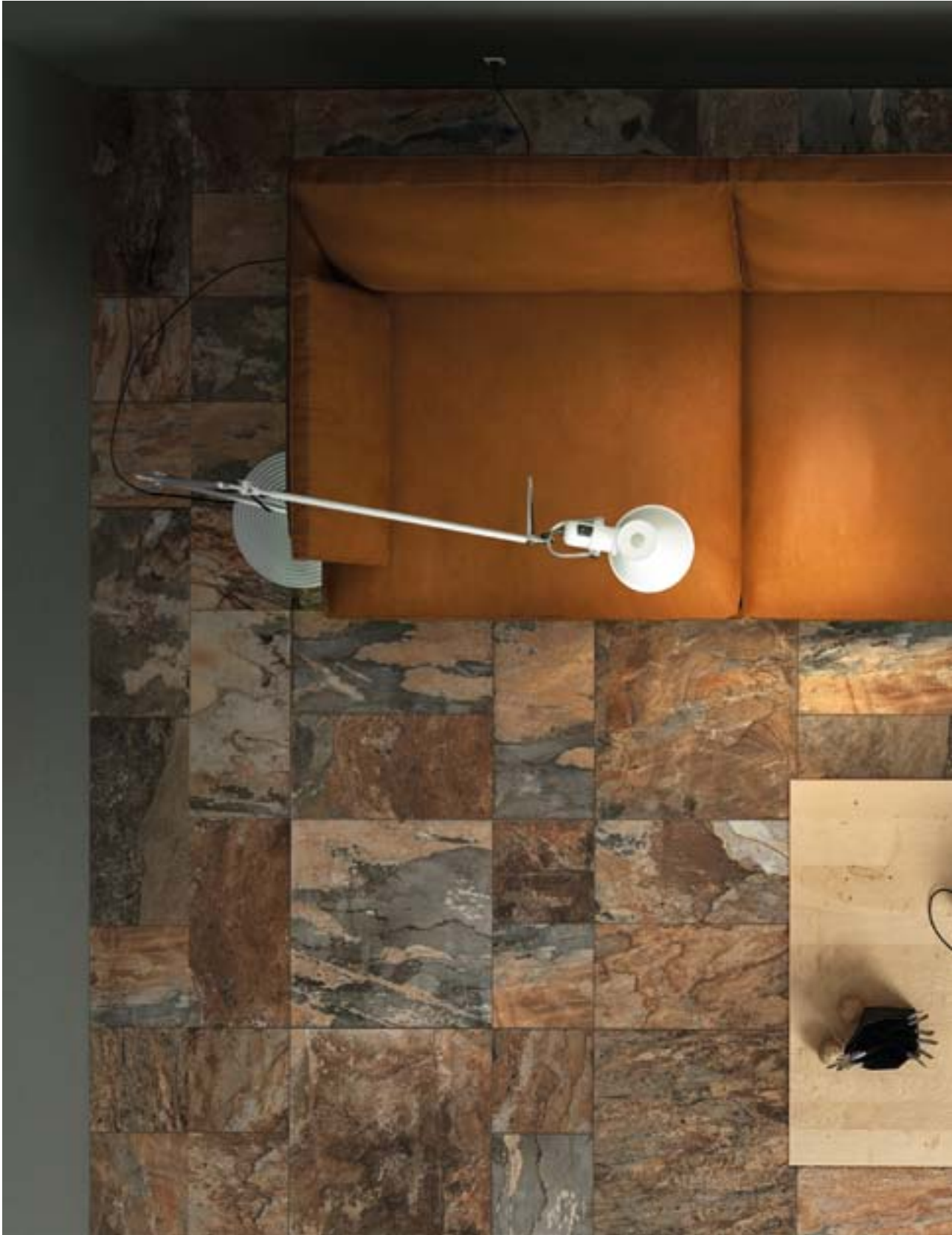
CP47768 Slate Multicolor Dark 45x45 CP47820 Slate Multicolor Dark 22,5x45 CP47817 Slate Multicolor Dark 22,5x22,5