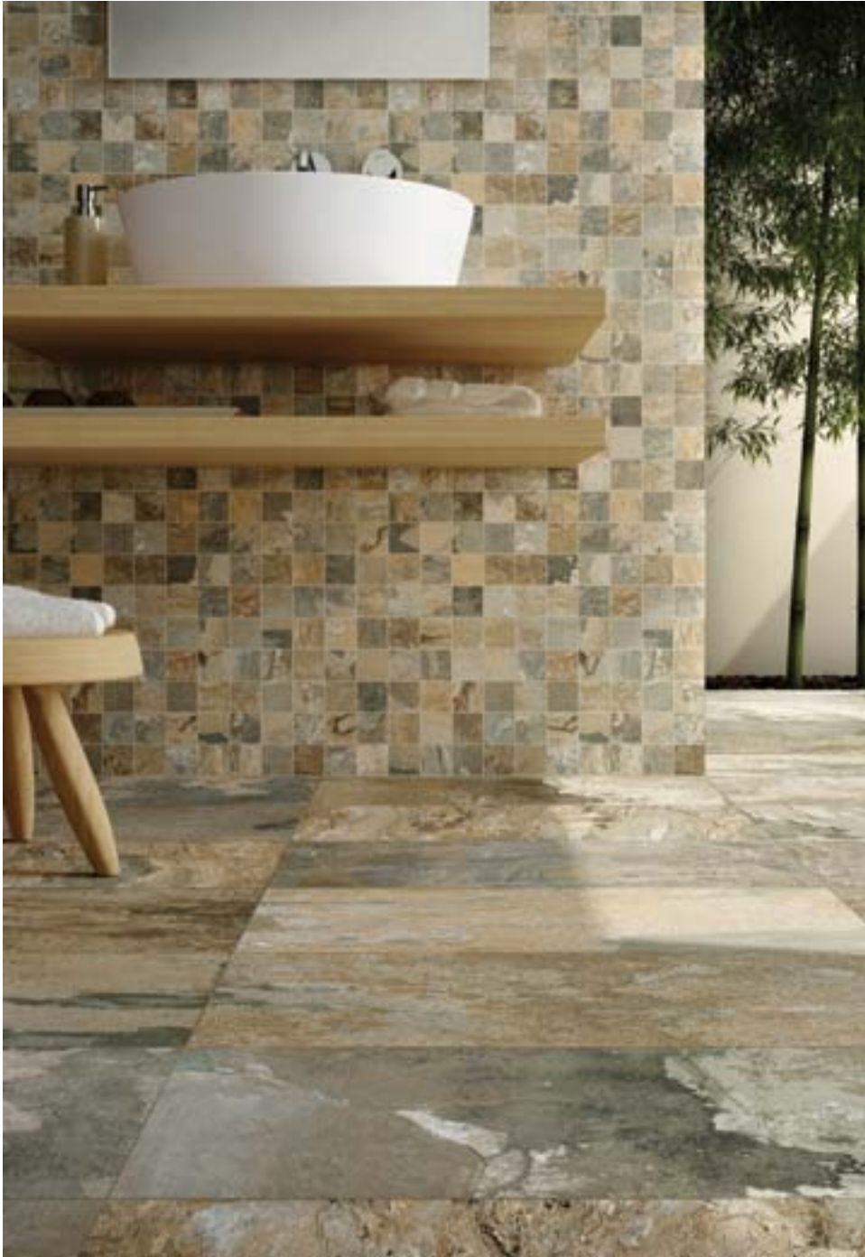
CP47775 Slate Multicolor Sage 30x60 CP47783 Slate Multicolor Sage Mosaic 5x5 - 30x30