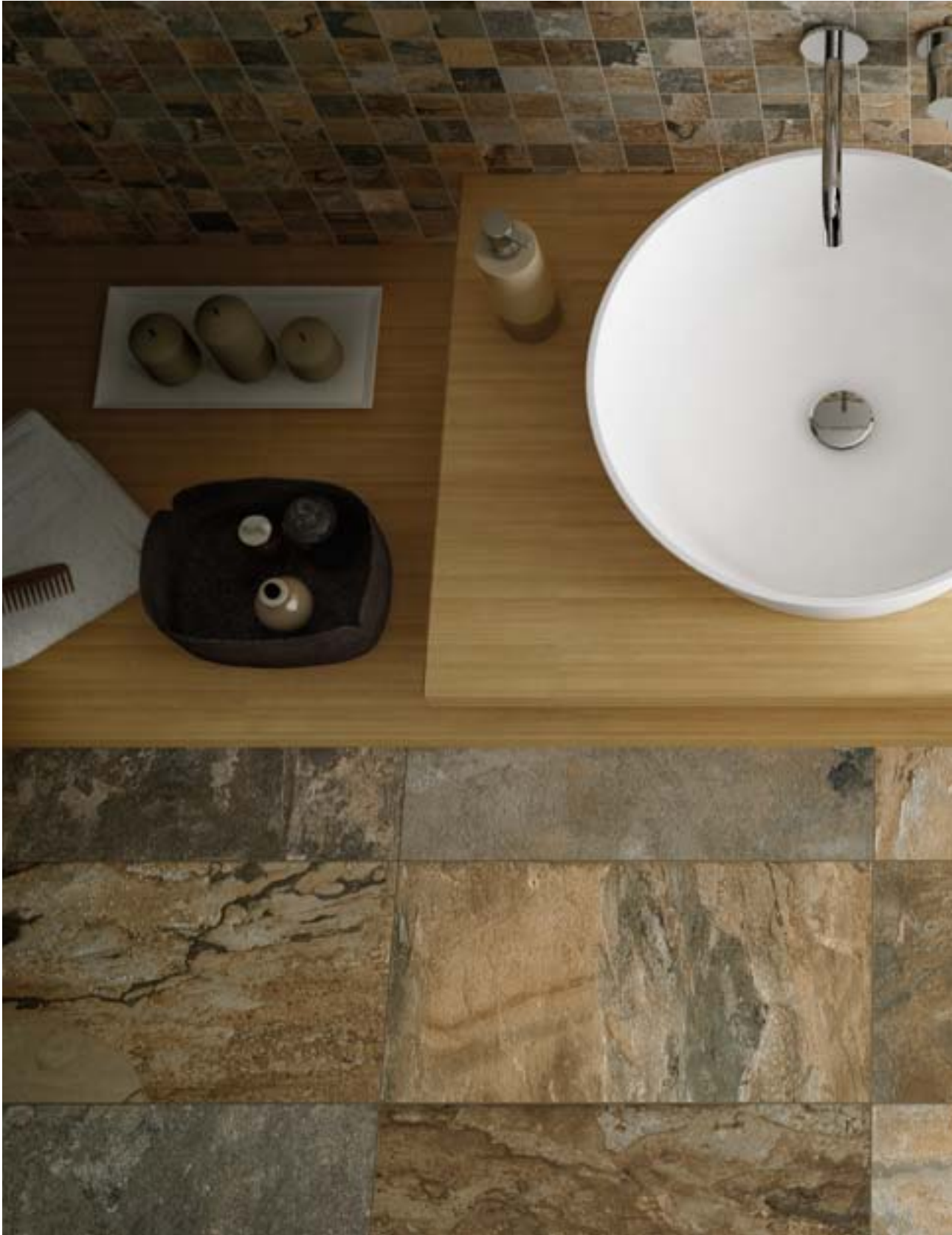
CP47775 Slate Multicolor Sage 30x60 CP47783 Slate Multicolor Sage Mosaic 5x5 - 30x30