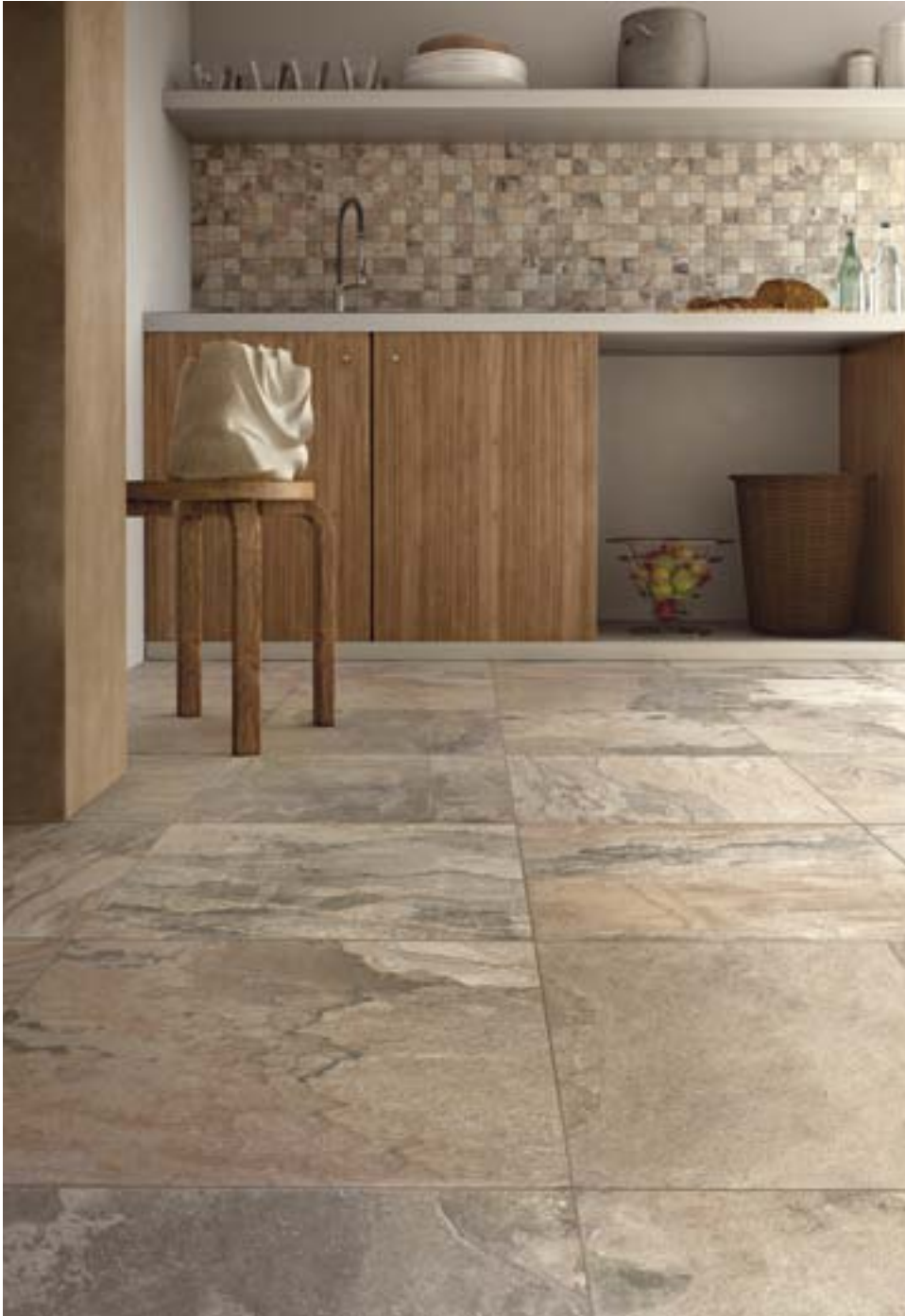
CP47769 Slate Multicolor Beige 45x45 CP47781 Slate Multicolor Beige Mosaic 5x5 - 30x30