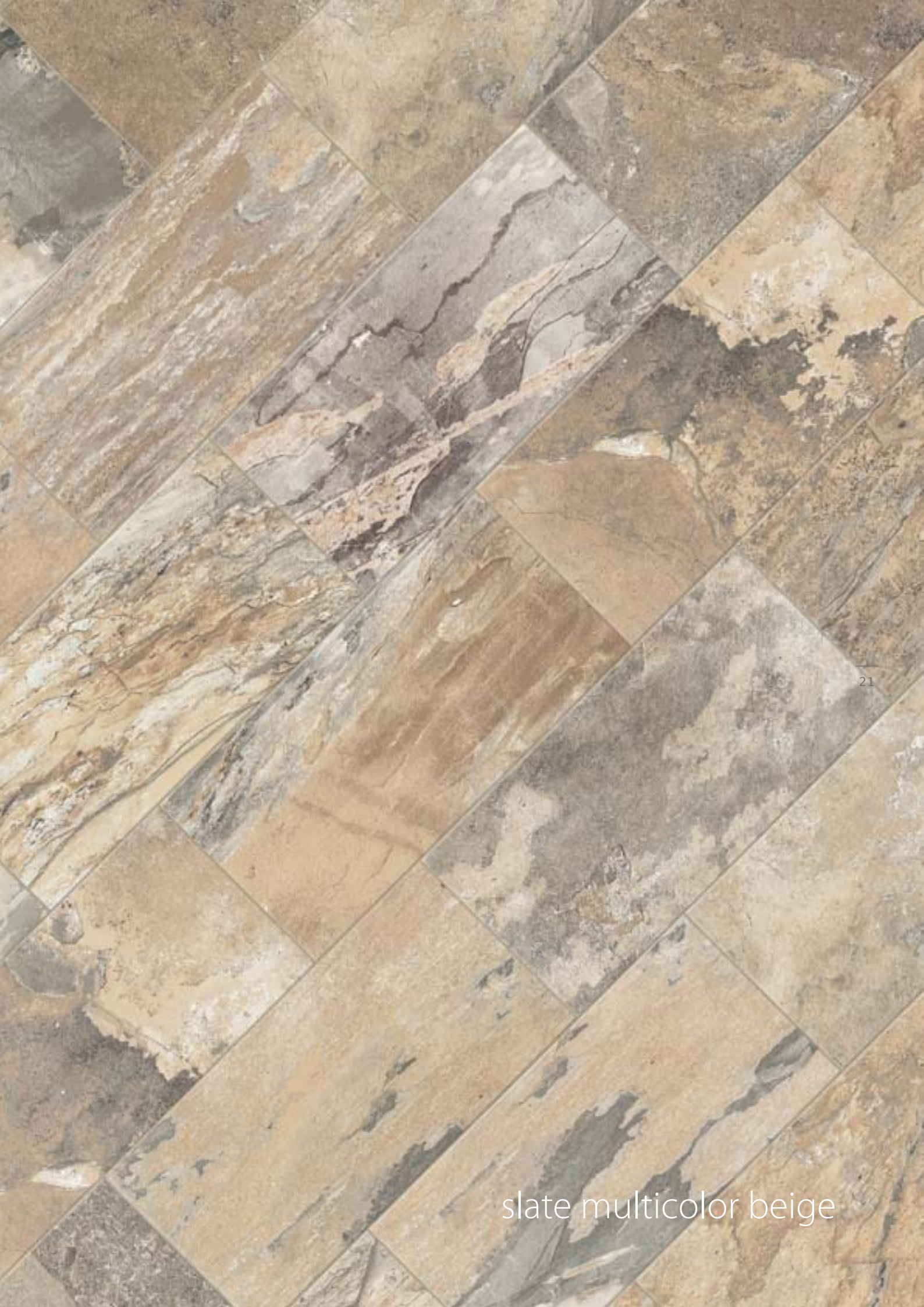
slate multicolor beige