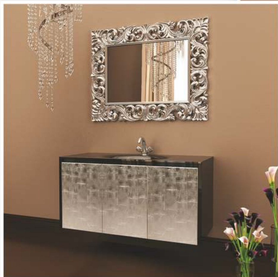
Можливі кольори дзеркал: