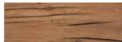
WADVE517 ○ 76 / m 2 lesk | glossy hnědá / brown / brązowa коричневый / barna / marrón