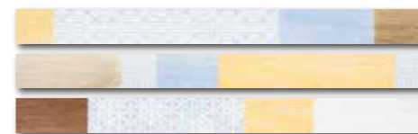
WLAVD518 ○ 88 / set lesk | glossy vícebarevná / multicoloured / kolorowa / многоцветный többszínű / multicolor