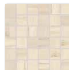
WDM06515 (SET) ○ 66 / set lesk | glossy světle béžová / light beige jasno-bežowa / светло-бежевый világosbézs / beige claro