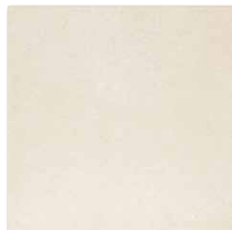
DAK63431 Base PEI 5 ○ 86 / m 2 mat | matt světle béžová / light beige / jasno-bežowa / светло-бежевый világosbézs / beige claro