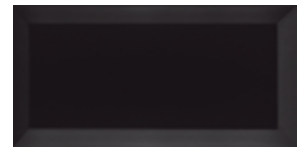
PICCADILLY BLACK 219671 / ZM 204