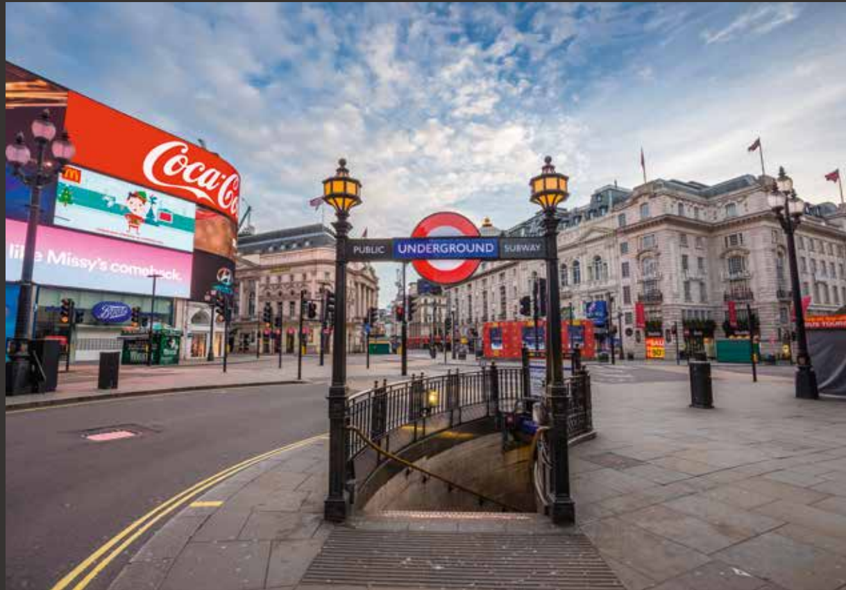
Piccadilly Circus Station, London