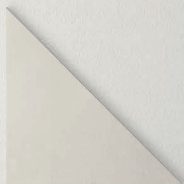
cm 25 x 25 x 35 (10"x10"x14")