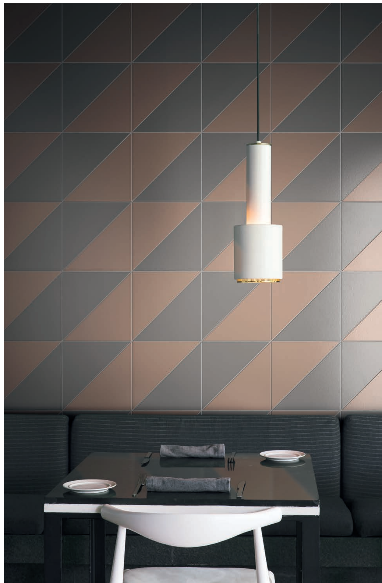
LIVING, rivestimento / covering PITTORICA 6/M-7/M-8/M-9/M-14/M (cm. 25x25x35 - 10"x10"x14")