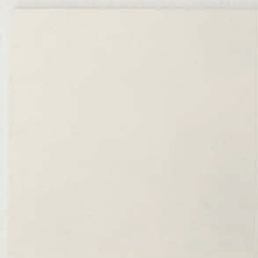
cm 25 x 25 (10"x10")

A collection of indoor floor and wall tiles made of rectified glazed stoneware, including fourteen matt colours in three categories - neutral, background and accent colours - and available in three different sizes. The choice of a solid matt colour giving the collection a silky consistency is enriched with a material texture recalling the weave of printed canvas stamped into the tile: subtle, almost imperceptible variations encouraging the onlooker to approach the tile and discover all its unique details. All Pittorica shapes and sizes, square 25x25 cm - rectangular 6x25 cm and triangular 25x25x35 cm, with a thickness of 10 mm - can be mixed and matched to permit complex, creative decorative schemes. The decorative properties of Pittorica are enhanced by the new rectified formats, which guarantee laying solutions with minimal joints for both floors and walls, bringing out the full, modern spirit of colour expressiveness.