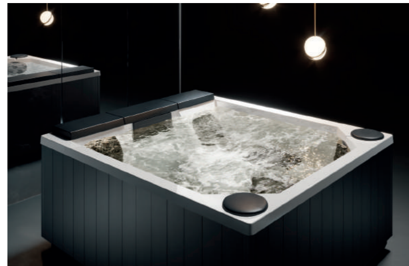
QUARZ 212 212 x 190 x H 90 CM