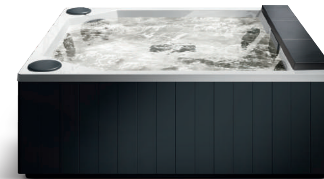
QUARZ 235 235 x 215 x H 90 CM