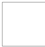
LOCK LITE 33,3x33,3 cm/13"x13" [PR] M312