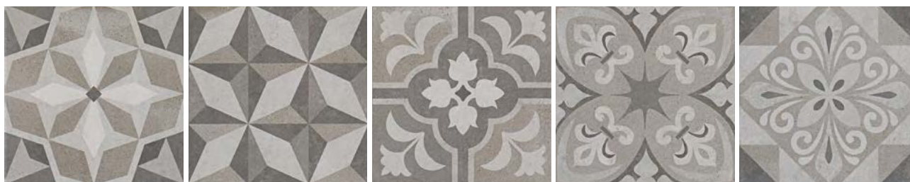
POWDER LITE DECOR COLD