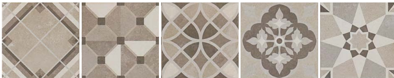
POWDER LITE DECOR WARM