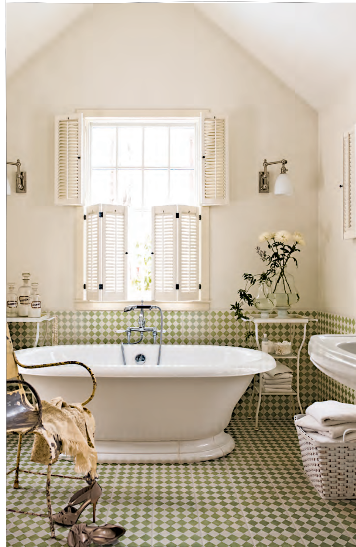
Pagina / Page 38 CUCINA / KITCHEN , rivestimento / coating QUEEN 6B (cm. 20x20 - 8"x8"), pavimento / flooring QUEEN 6D (cm. 40x40 - 16"x16")