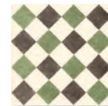
QUEEN 6B - PEI IV