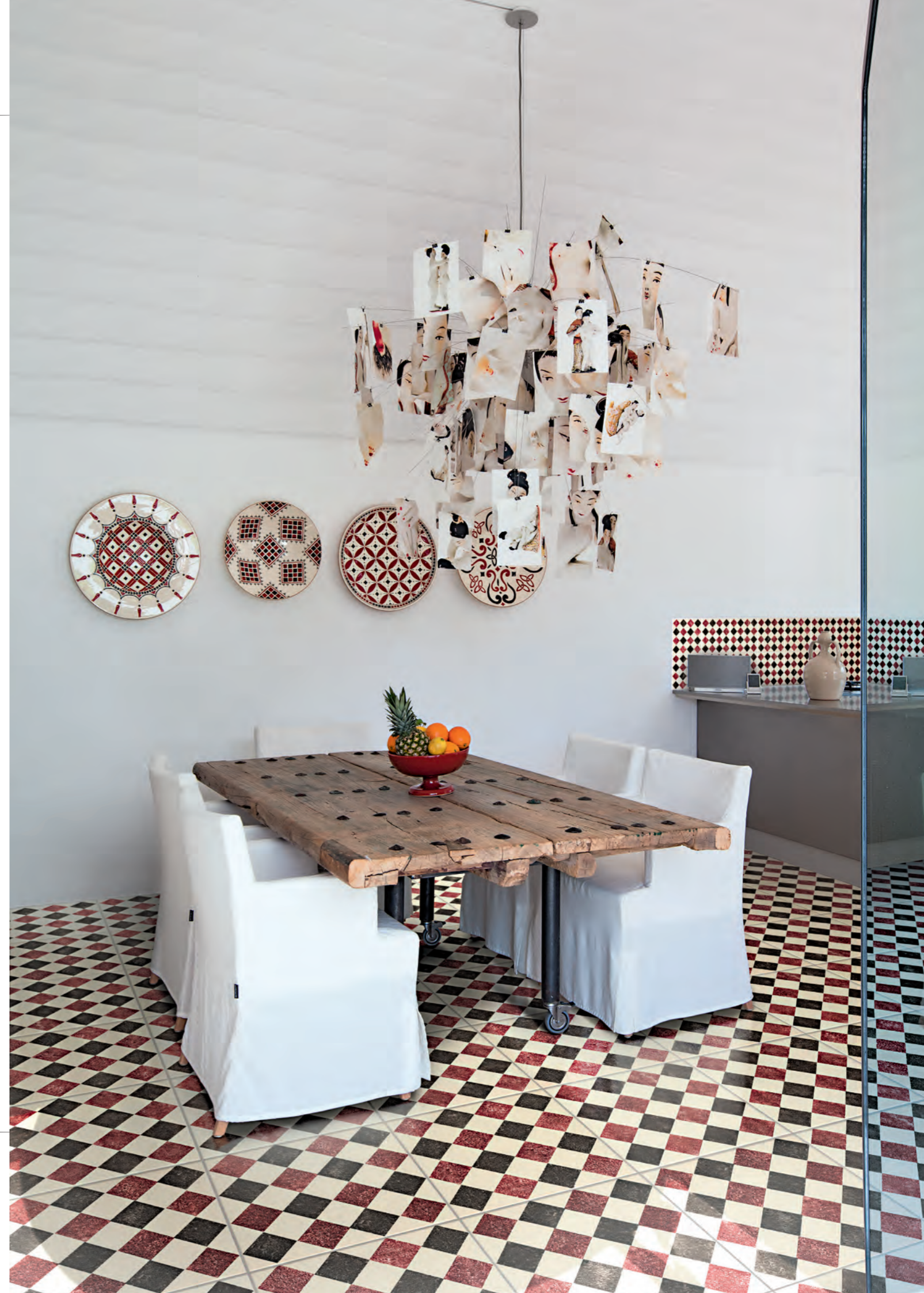
Pagina / Page 43 CUCINA / KITCHEN , rivestimento / coating QUEEN 5B (cm. 20x20 - 8"x8"), pavimento / flooring QUEEN 5D (cm. 40x40 - 16"x16")