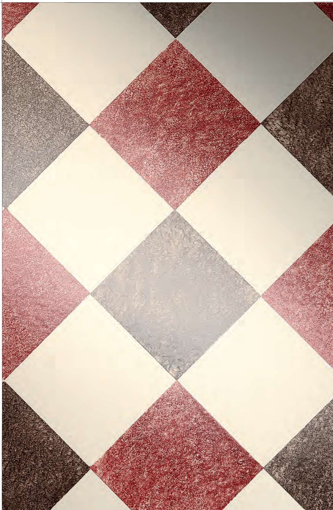
DETTAGLIO / DETAIL, QUEEN 5D