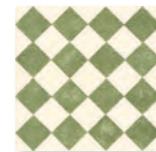
QUEEN 6A - PEI IV