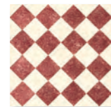
QUEEN 5A - PEI III