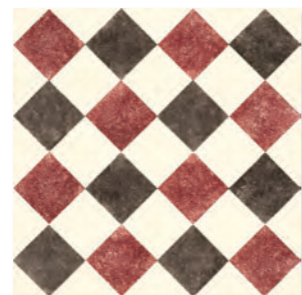
QUEEN 5D - PEI III