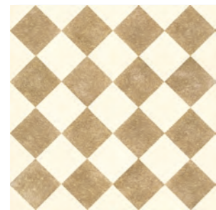
QUEEN 4C - PEI IV