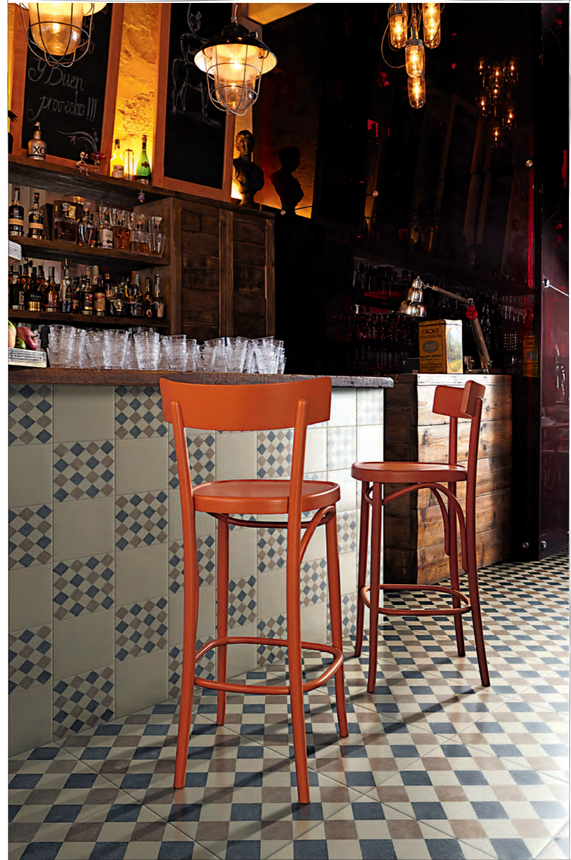
Pagina / Page 44 CUCINA / KITCHEN , rivestimento / coating QUEEN 1A-2A-3A-4A-5A-6A (cm. 20x20 - 8"x8")