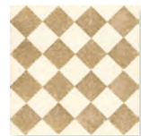
QUEEN 4A - PEI IV