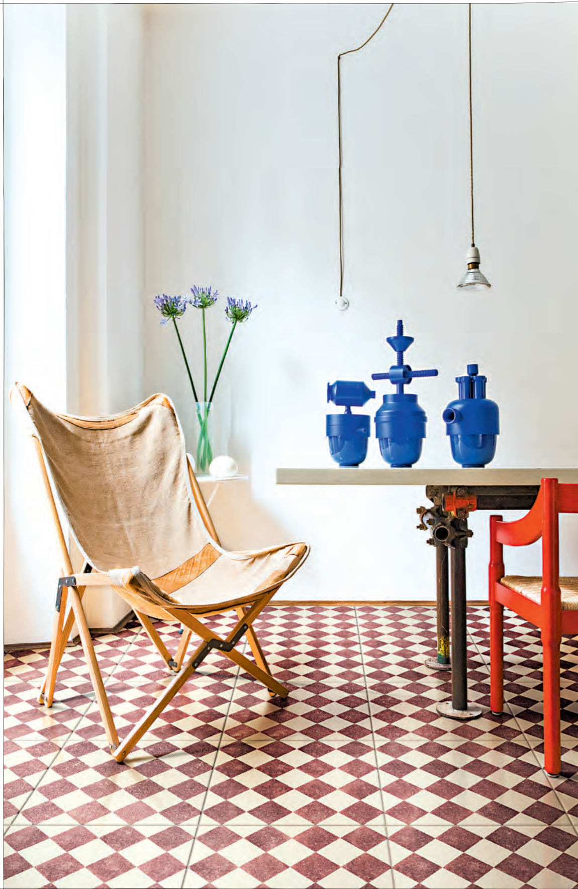
Pagina / Page 42 CUCINA / KITCHEN , pavimento / flooring QUEEN 5C (cm. 40x40 - 16"x16")