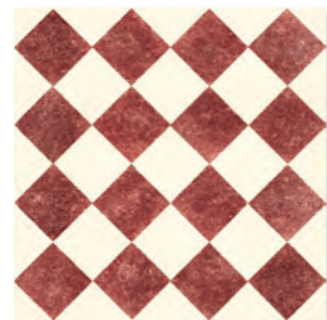
QUEEN 5C - PEI III