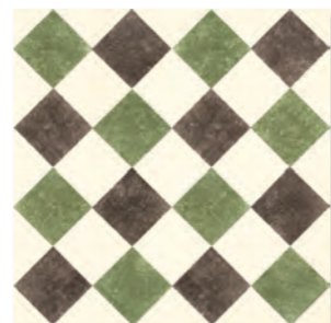
QUEEN 6D - PEI IV