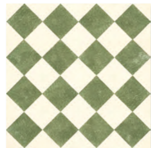
QUEEN 6C - PEI IV