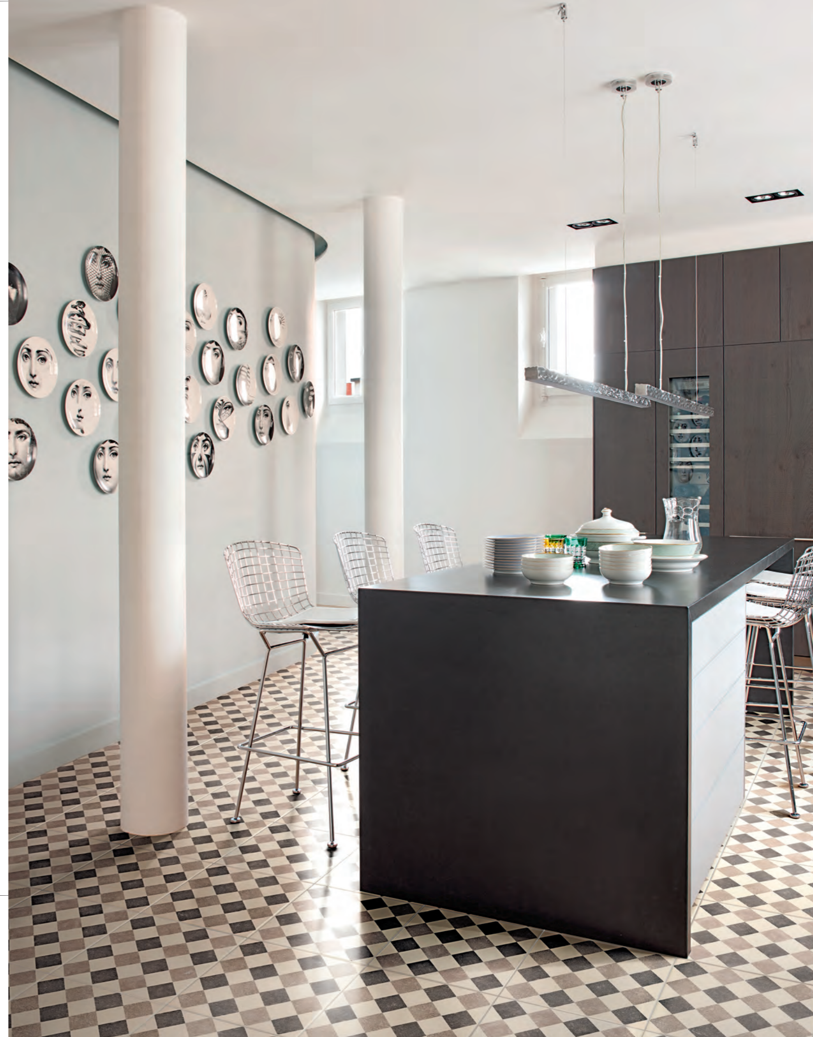
Pagina / Page 35 CUCINA / KITCHEN , pavimento / flooring QUEEN 2D (cm. 40x40 - 16"x16")