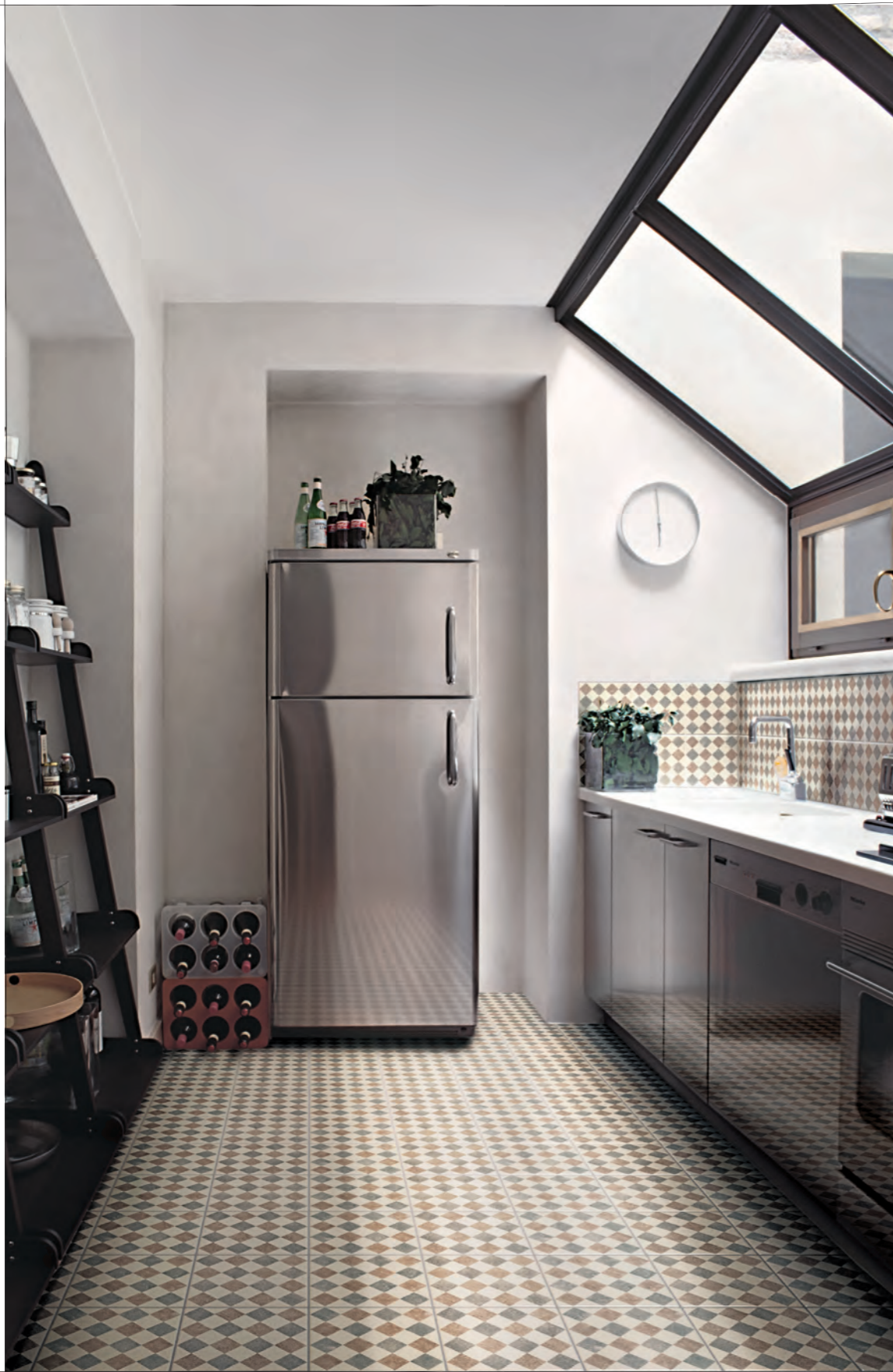
Pagina / Page 34 CUCINA / KITCHEN , rivestimento / coating QUEEN 3B (cm. 20x20 - 8"x8"), pavimento / flooring QUEEN 3B (cm. 20x20 - 8"x8")