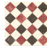
QUEEN 5B - PEI III