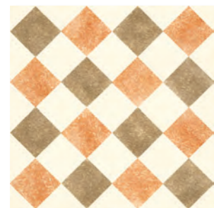
QUEEN 4D - PEI IV