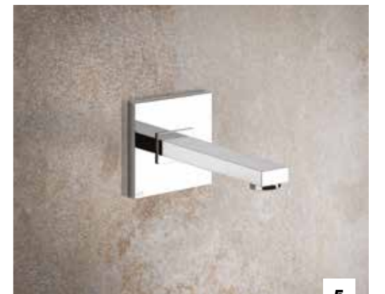
5. 20114 WALL-MOUNTED SPOUT, PROJECTION 207 MM / BOCCA DA PARETE, EROGAZIONE 207 MM 20118 CUSTOM