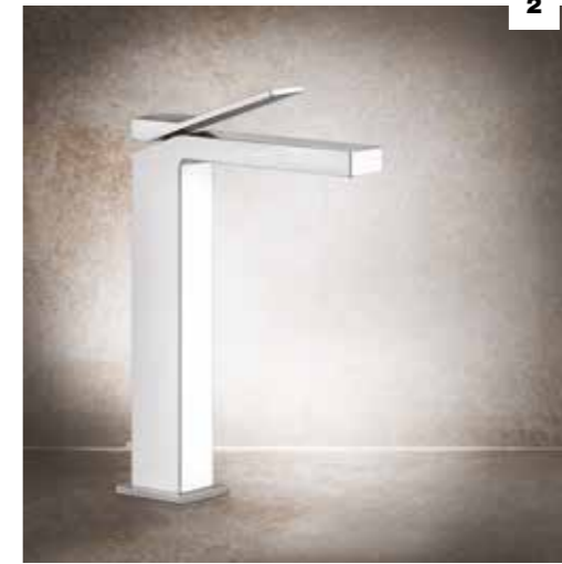
2. 53005 HIGH VERSION BASIN MIXER, WITH WASTE, L=128 MM / MISCELATORE MONOCOMANDO LAVABO ALTO, CON SCARICO, L=128 53006 WITHOUT WASTE / SENZA SCARICO