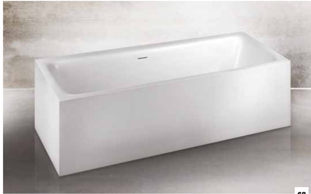
68. 37593 FREESTANDING BATHTUB, CRISTALPLANT® (MATT WHITE) / VASCA FREESTANDING IN CRISTALPLANT® (BIANCO OPACO)