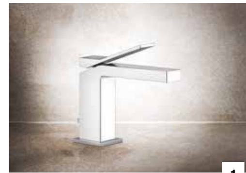
1. 53001 BASIN MIXER WITH WASTE / MISCELATORE MONOCOMANDO LAVABO, CON SCARICO 53002 WITHOUT WASTE / SENZA SCARICO