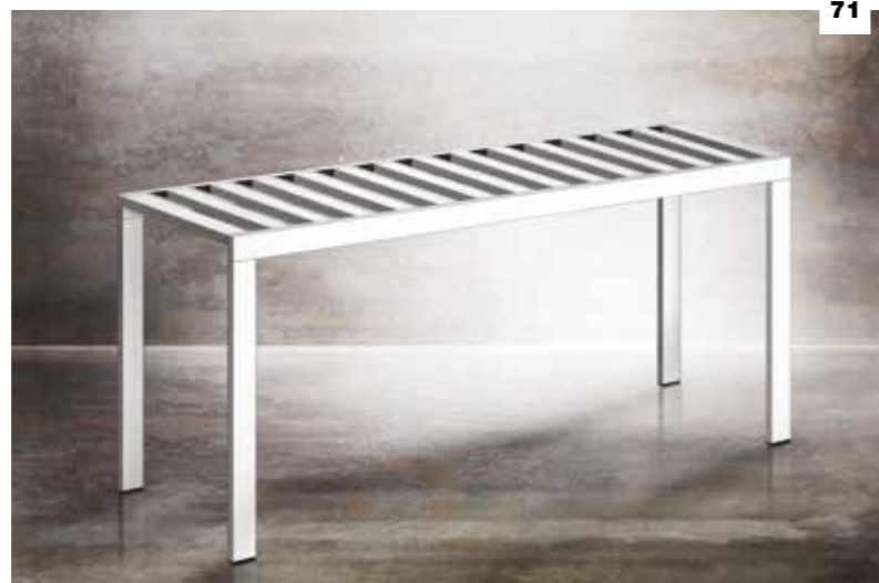
71. 20984 BENCH / PANCA