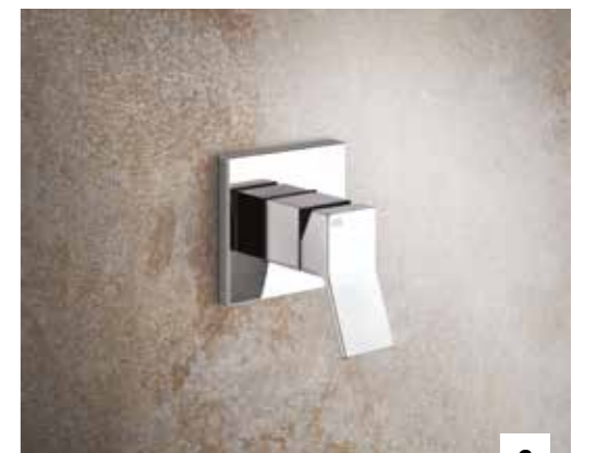
6. 46112_53109 ONE-WAY MIXER / MISCELATORE AD UNA USCITA