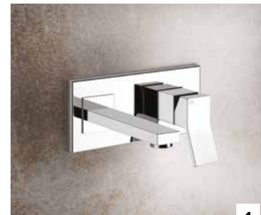
4. 44697_53089 BUILT-IN MIXER WITH SPOUT, WITHOUT WASTE / MISCELATORE MONOCOMANDO AD INCASSO CON BOCCA, SENZA SCARICO 44697_53089 L=147 MM 44697_53088 L=207 MM 44697_53090 L=257 MM 44697_53084 CUSTOM