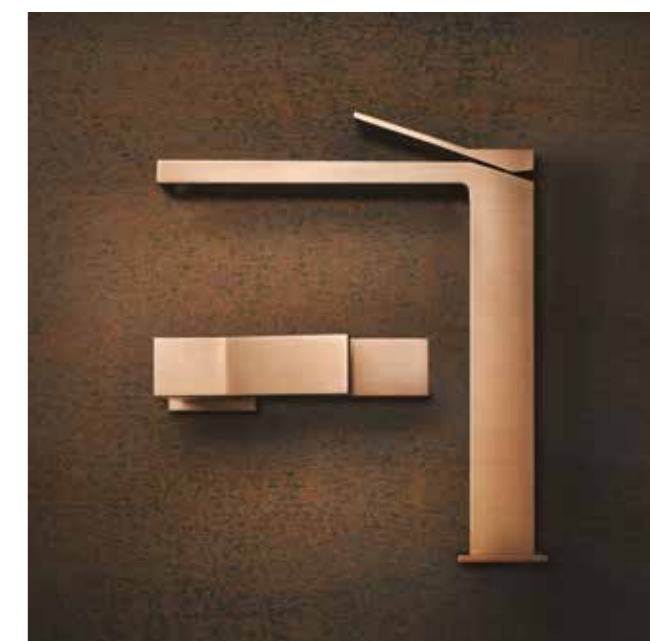
53002#708 Basin mixer without waste / Miscelatore monocomando lavabo, senza scarico