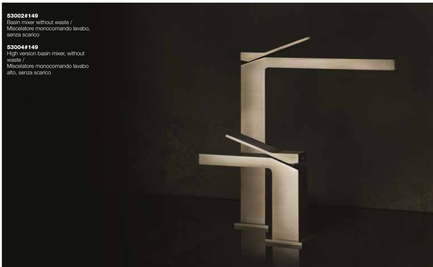
53004#149 High version basin mixer, without waste / Miscelatore monocomando lavabo alto, senza scarico

A smart detour from the customary bears uniqueness and charm