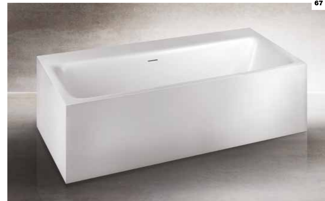
67. 37594 FREESTANDING BATHTUB IN CRISTALPLANT® (MATT WHITE) WITH SIDE LEDGE / VASCA FREESTANDING IN CRISTALPLANT® (BIANCO OPACO) CON BORDO LATERALE 37598 MADE TO MEASURE 1800/1900 X 810/1050 MM