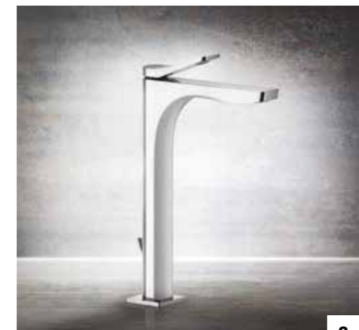
4. 59009 HIGH VERSION BASIN MIXER, WITH WASTE Ø 35 / MISCELATORE MONOCOMANDO LAVABO ALTO, CON SCARICO Ø 35 59010 WITHOUT WASTE / SENZA SCARICO