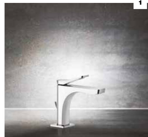
1. 59001 BASIN MIXER WITH WASTE / MISCELATORE MONOCOMANDO LAVABO, CON SCARICO 59002 WITHOUT WASTE / SENZA SCARICO