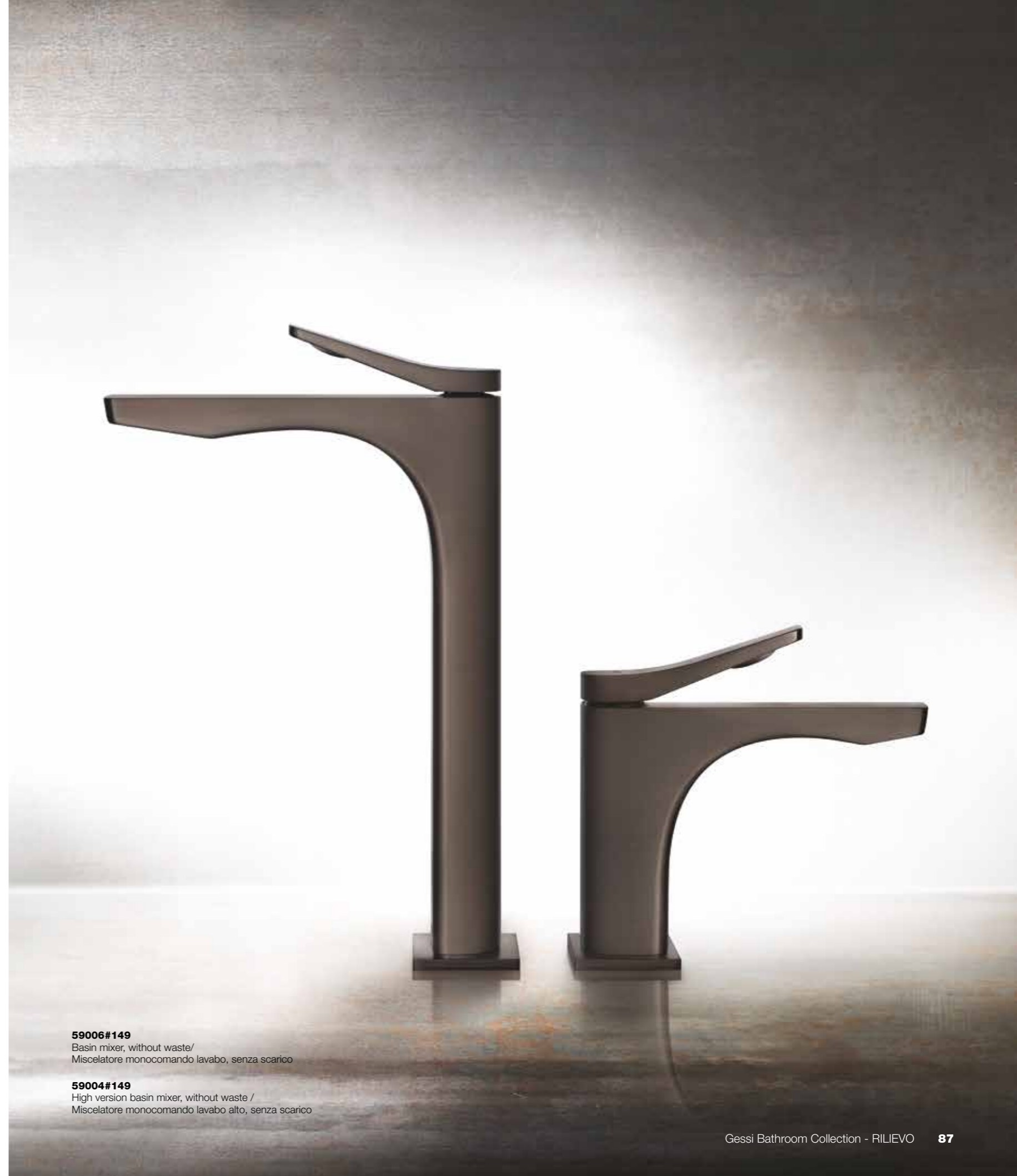
59004#149 High version basin mixer, without waste / Miscelatore monocomando lavabo alto, senza scarico