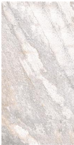
ROCA POLAR C-1 / C-3 33 x 66,5 cm - 13.0' x 26.2' 10 mm