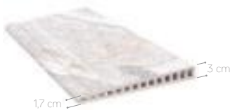
BORDE DESBORDANTE C-3 28 x 66,5 cm - 11.0' x 26.2'