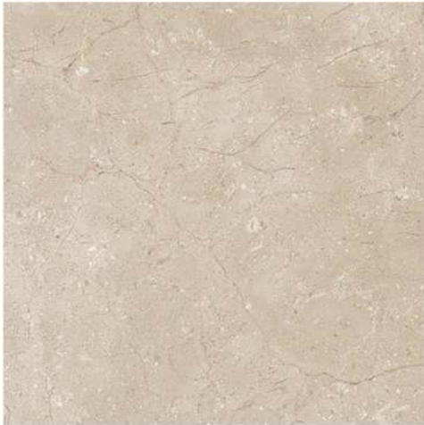
Pav. Royal 45 x 45 CM GT1