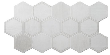
SATURN DECOR MIX