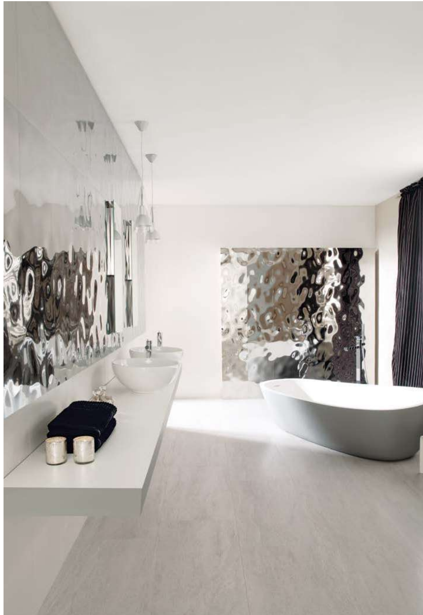
SEA SILVER 33,3 cm x 100 cm - MADAGASCAR NATURAL 69,6 cm x 69,6 cm