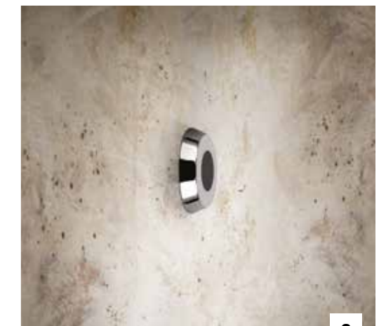
2. 30629_45125 BUILT-IN ELECTRONIC SEPARATE CONTROL / COMANDO REMOTO ELETTRONICO A INCASSO