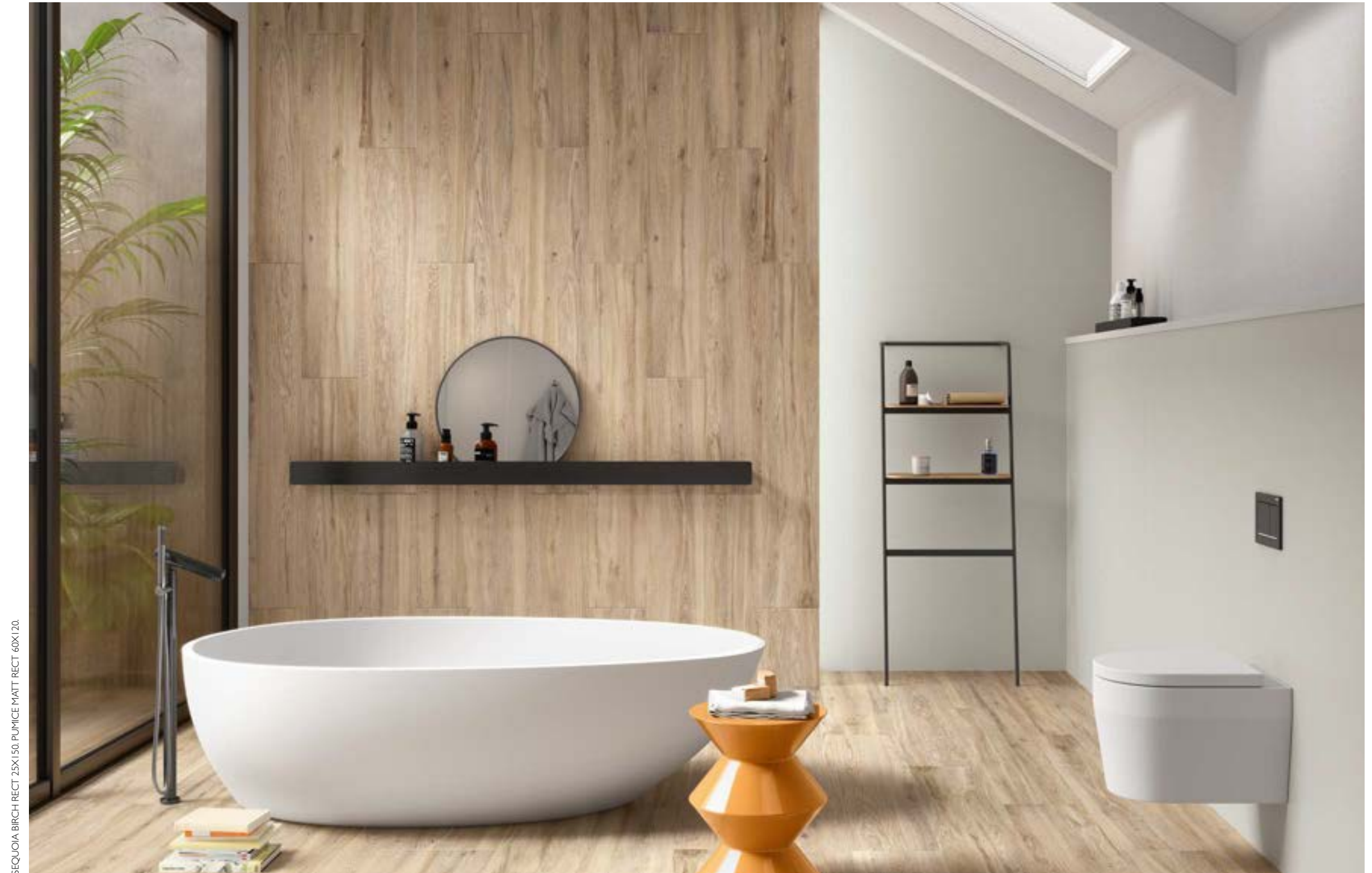
SEQUOIA BIRCH RECT 25X150 PUMICE MATT RECT 60X120.

C3 R11 ANTI-SLIP SEQUOIA CHERRY TREE RECT 25 X 150 / 10" X 59" L87/M