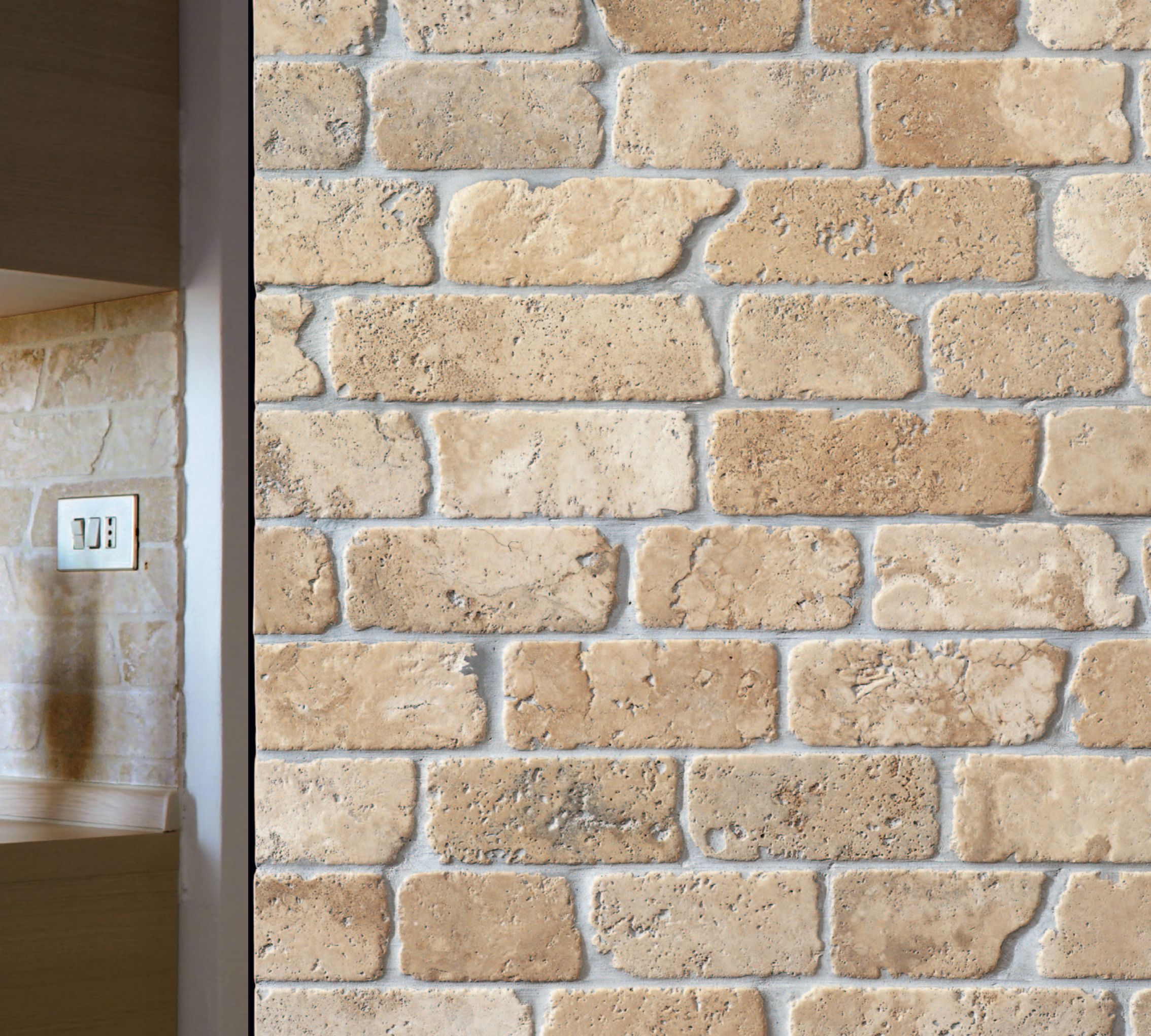
TRAVERTINO CHIARO | FILARE