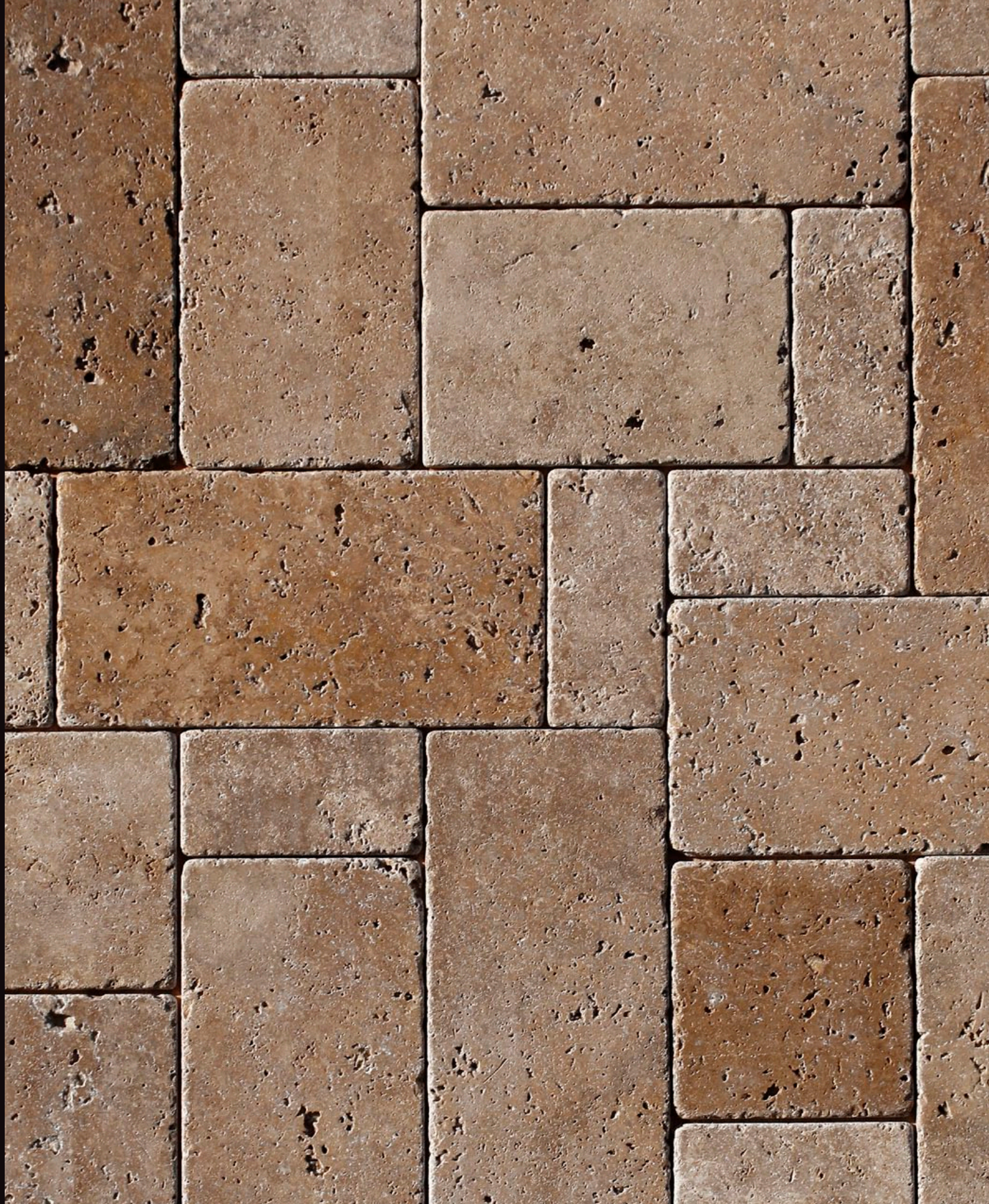
TRAVERTINO NOCE | ROMANICA