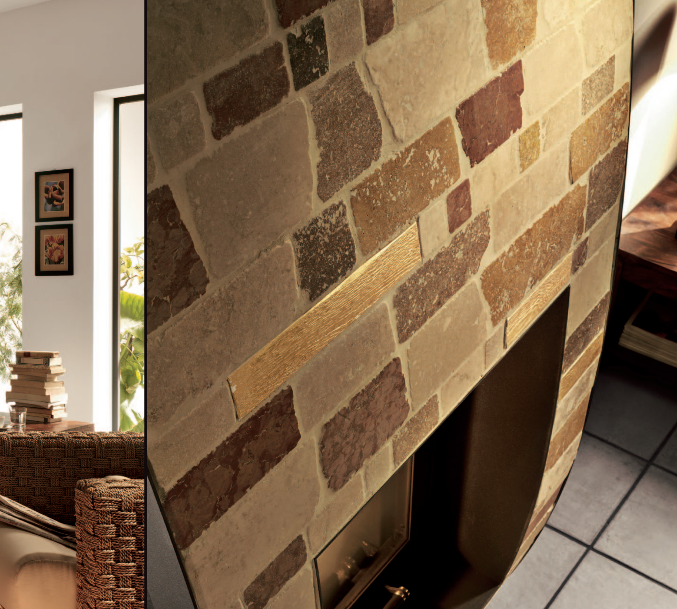
MARMO _ LEGNO | FILARE