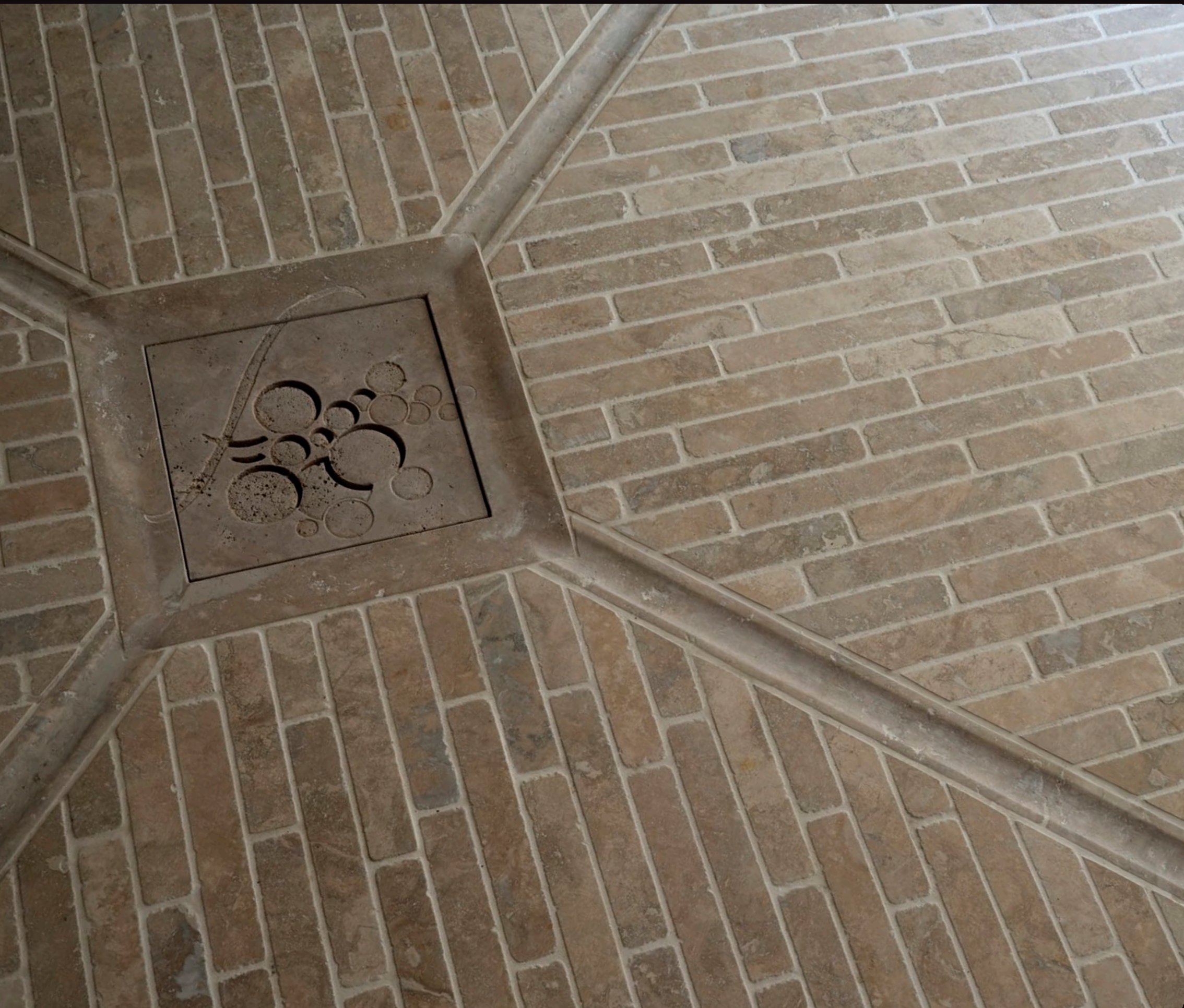
TRAVERTINO NOCE | 4x30