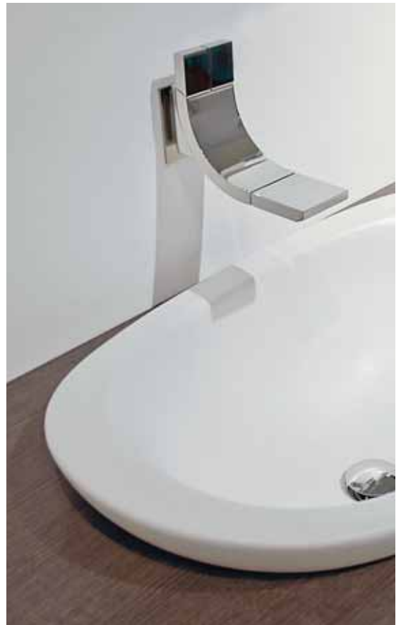
Si art. SI2042U