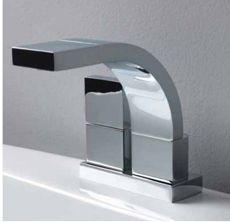
Si art. SI2023