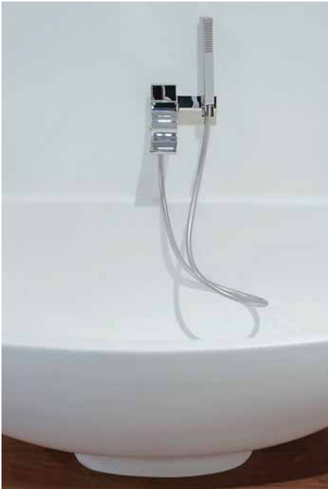
Si art. SI2081

Collection of taps which, with the simple folding of a linear band in chrome-plated brass, satisfies different necessities of supplying and using water in the bathroom. A single graphic sign, formally clean, that in all versions expresses an exact match between shape and function.