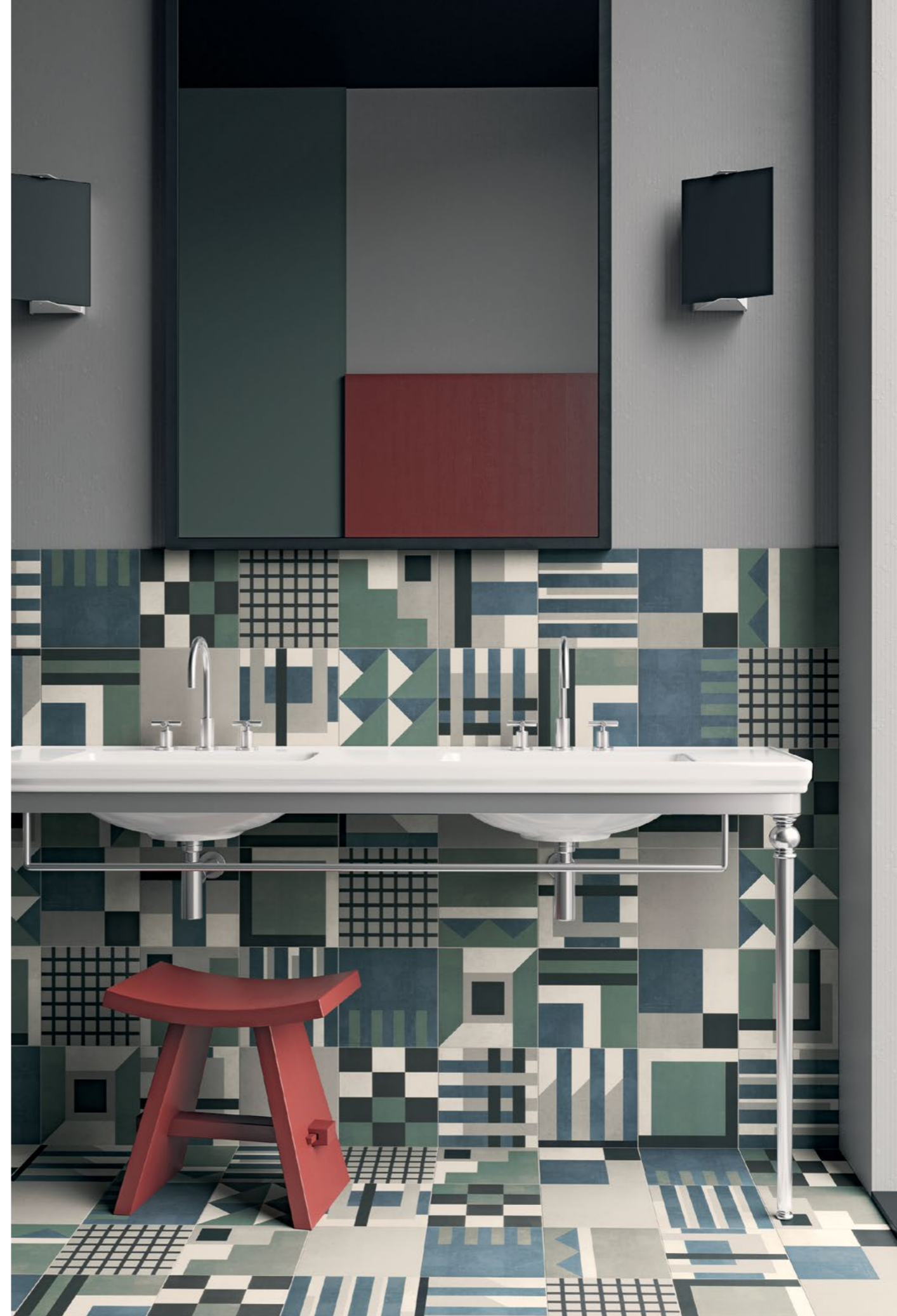
BAGNO / BATHROOM, rivestimento / covering SODA 2 - 2F (cm. 25x25 - 10"x10"). Pavimento / flooring SODA 2 - 2F (cm. 25x25 - 10"x10").