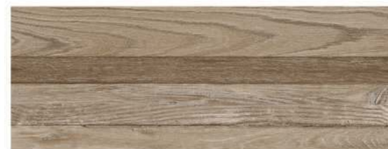
Soka Roble 21,5 x 58 CM