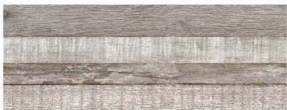
Soka Natural 21,5 x 58 CM