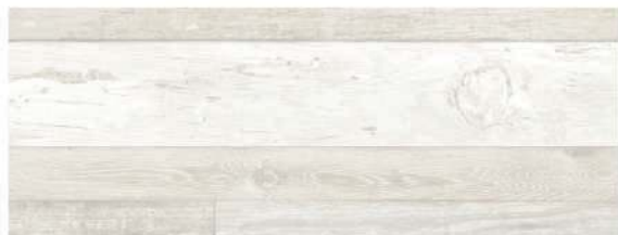
Soka White 21,5 x 58 CM