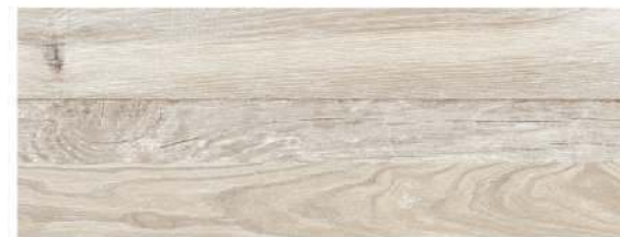
Soka Nordic 21,5 x 58 CM