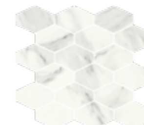
MODULUS STATUARIO WHITE (a) (f)