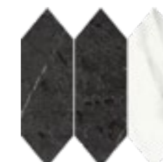
PEAK (a) (f)