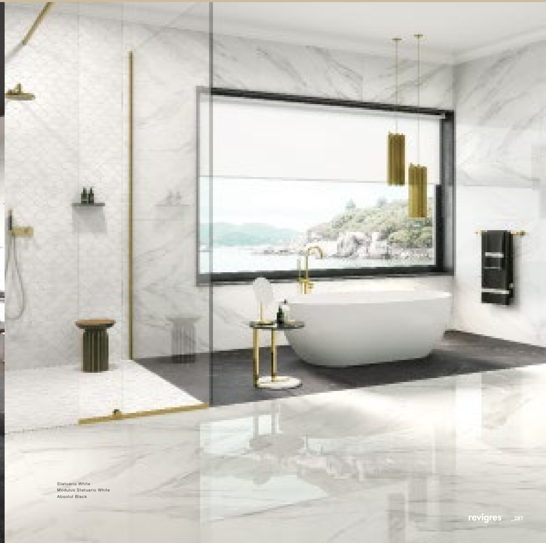
Statuario White Modulus Statuario White Absolut Black