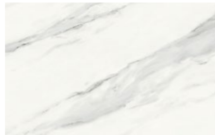
STATUARIO WHITE (i)