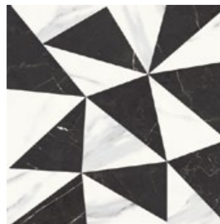
STATUARIO WHITE FRAGMENTUS