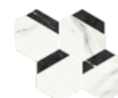
HEXA (a) (f)