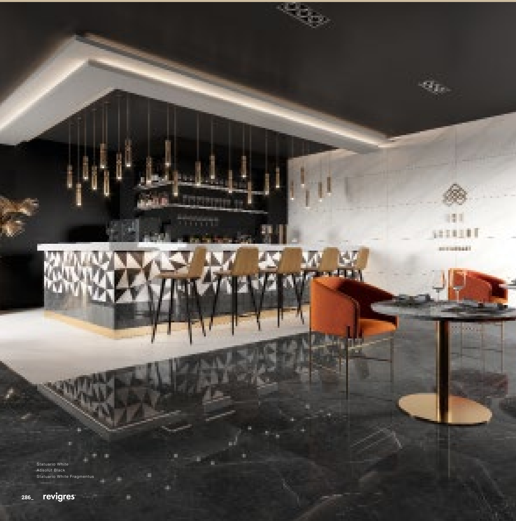
Statuario White Absolut Black Statuario White Fragmentus

A pureza da matéria refletida na cerâmica para ambientes exclusivos. The purity of the material reflected in ceramics for exclusive environments. La pureté de la matière reflétée dans la céramique pour des ambiances exclusives. La pureza de la materia reflejada en la cerámica para ambientes exclusivos.