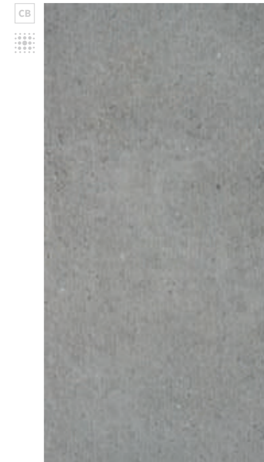
Stavanger Gris 60x120 R

COLORED BODY CB PORCELÁNICO MASA COLOREADA CARACTERÍSTICA TÉCNICA Y ESTÉTICA QUE REALZA Y UNIFICA VISUALMENTE EL PRODUCTO CERÁMICO. NANOTECH SMOOTH & CLEAN ANTISLIP SURFACE Superficie antideslizante con textura suave