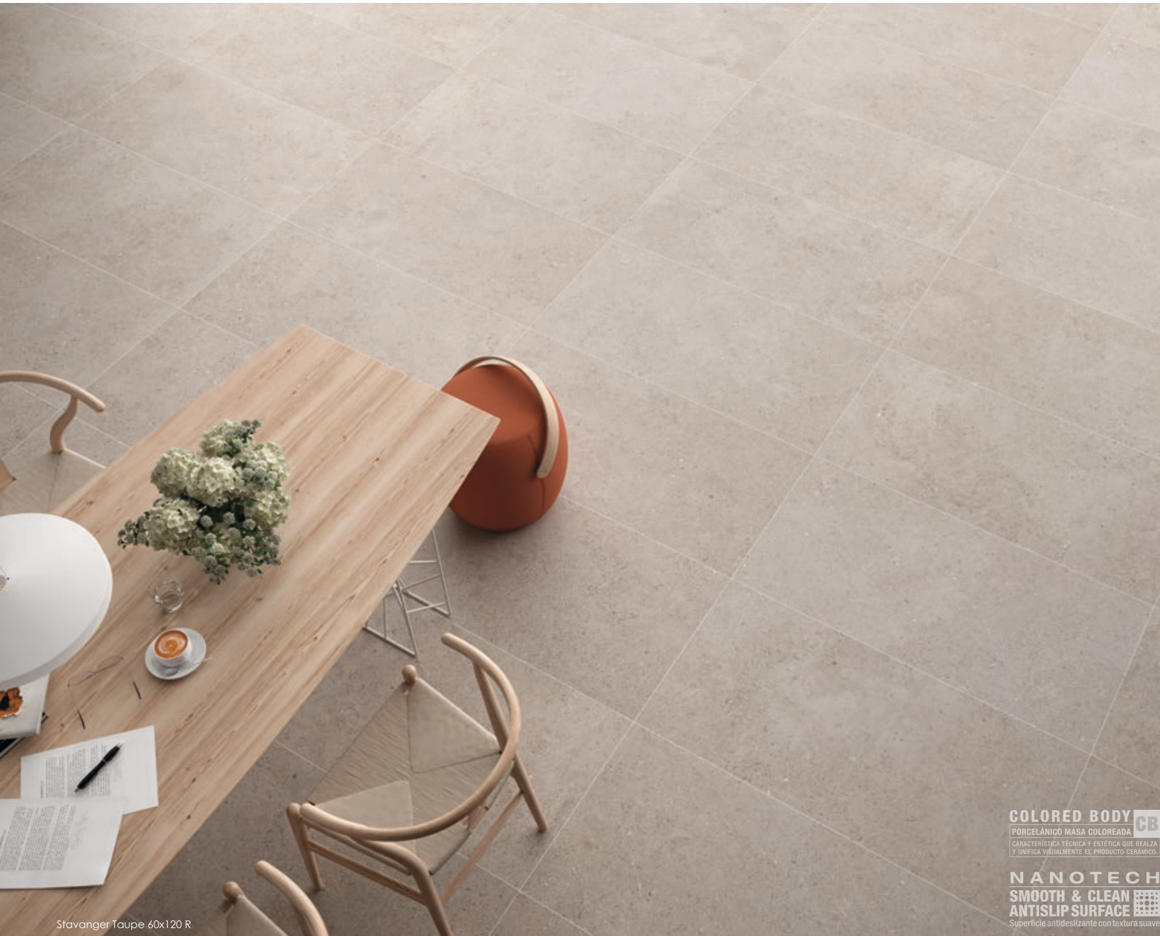
Stavanger Taupe 60x120 R

COLORED BODY CB PORCELÁNICO MASA COLOREADA CARACTERÍSTICA TÉCNICA Y ESTÉTICA QUE REALZA Y UNIFICA VISUALMENTE EL PRODUCTO CERÁMICO. NANOTECH SMOOTH & CLEAN ANTISLIP SURFACE Superficie antideslizante con textura suave