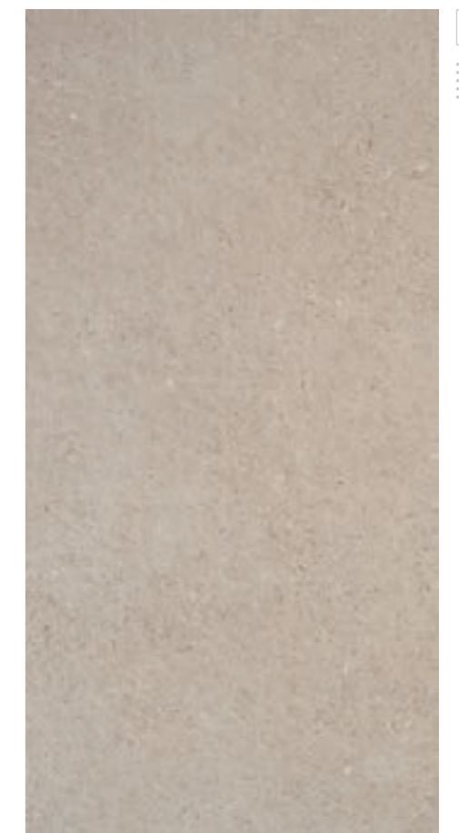
Stavanger Taupe 60x120 R