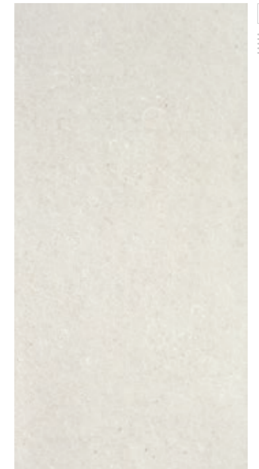
Stavanger Arena 60x120 R