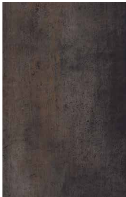
the collection Steel Dark