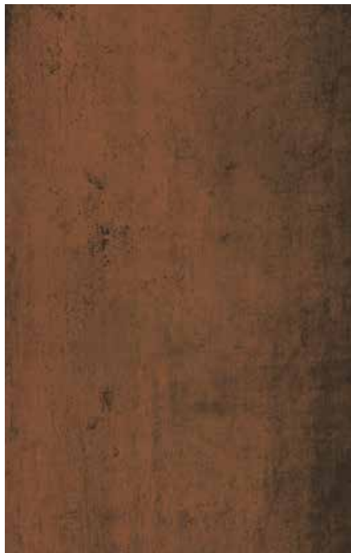
the collection Steel Corten