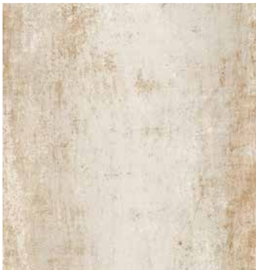
the collection Steel White