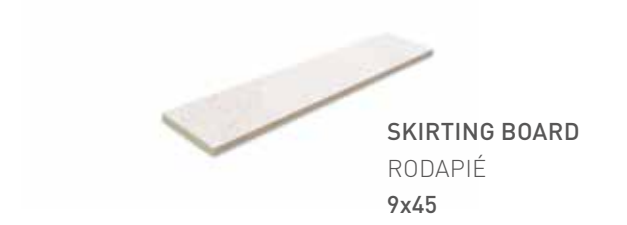
SKIRTING BOARD RODAPIÉ 9x45