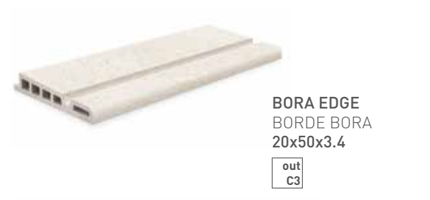
BORA EDGE BORDE BORA 20x50x3.4 out C3