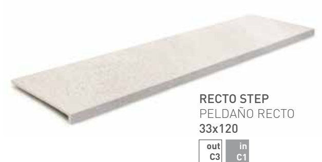
RECTO STEP PELDAÑO RECTO 33x120 out C3 in C1