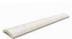
MDCA E000 4.5x50 cm