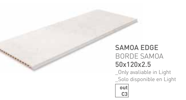
SAMOA EDGE BORDE SAMOA 50x120x2.5 _Only available in Light _Solo disponible en Light out C3