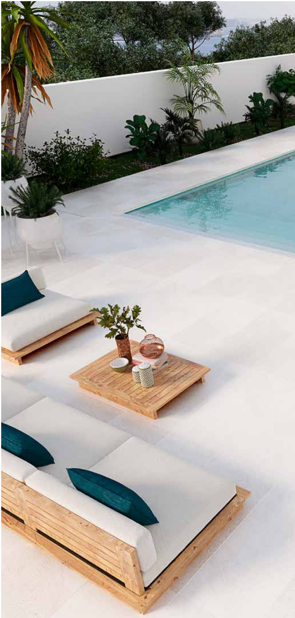
Stromboli LIGHT 60x120 cm