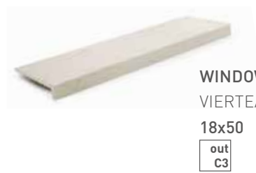
WINDOW SILLS VIERTEAGUAS 18x50 out C3