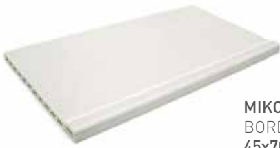
MIKONOS EDGE BORDE MIKONOS 45x70x3/3.5