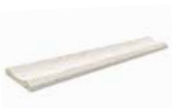
MDCA I000 6x50 cm