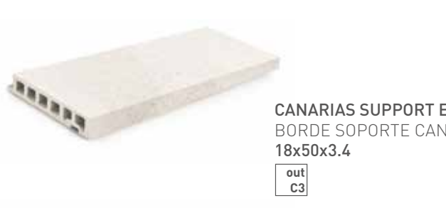
CANARIAS SUPPORT EDGE BORDE SOPORTE CANARIAS 18x50x3.4 out C3