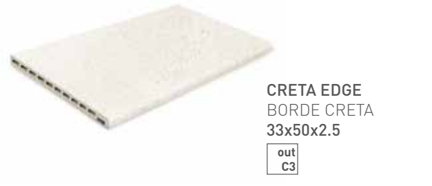
CRETA EDGE BORDE CRETA 33x50x2.5 out C3