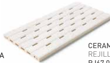
CERAMIC DRAIN GRATE REJILLA DE DRENAJE CERÁMICA RJ67 0000 25x50x2.2

Drain - Desagüe: >19.4m 3 /hora Grate Rubber 9710 included Goma p/Rejilla incluida ANTISHOCK