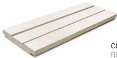
CERAMIC DRAIN GRATE REJILLA DE DRENAJE CERÁMICA RJ70 0000 20x50x2.2

Drain - Desagüe: >19.4m 3 /hora Grate Rubber 9710 included Goma p/Rejilla 9710 incluida ANTISHOCK