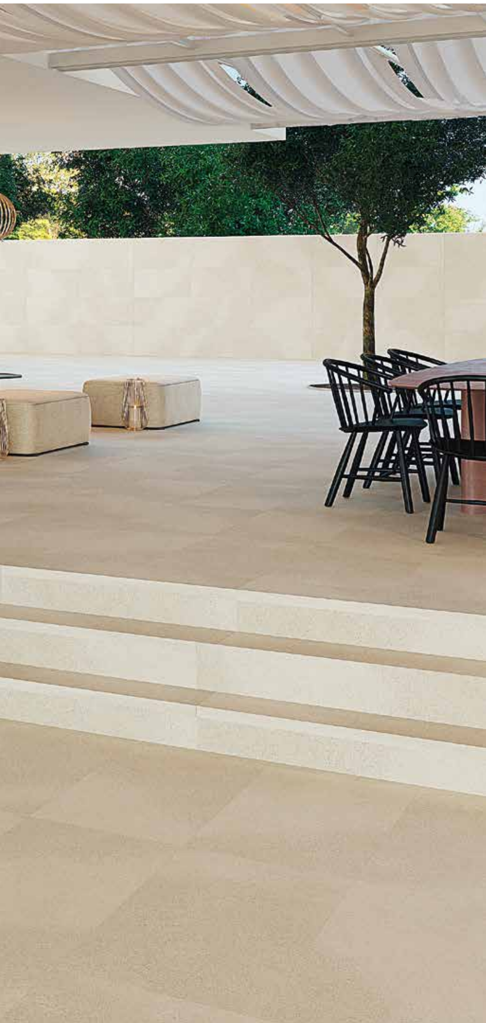
Stromboli CREAM 75x75 cm