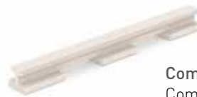
Component: Grate Rubber included Componente: Goma p/Rejilla incluida Art. 9710