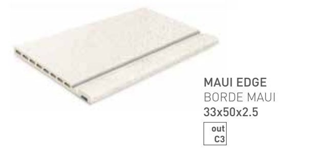
MAUI EDGE BORDE MAUI 33x50x2.5 out C3