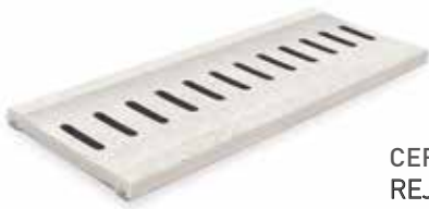
CERAMIC DRAIN GRATE REJILLA DE DRENAJE CERÁMICA RJ55 0000 20x50x2.2