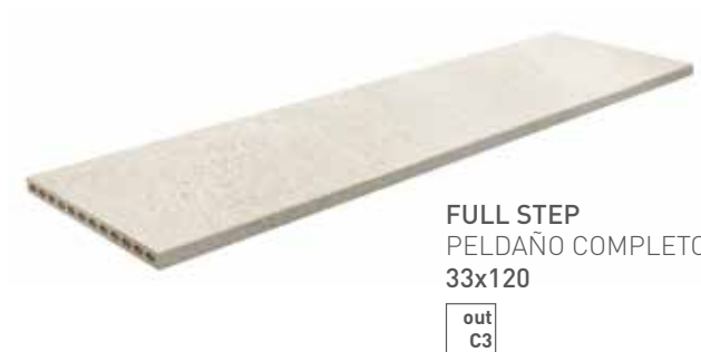
FULL STEP PELDAÑO COMPLETO 33x120 out C3