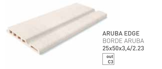
ARUBA EDGE BORDE ARUBA 25x50x3,4/2.23 out C3