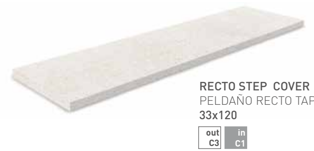
RECTO STEP COVER PELDAÑO RECTO TAPA 33x120 out C3 in C1