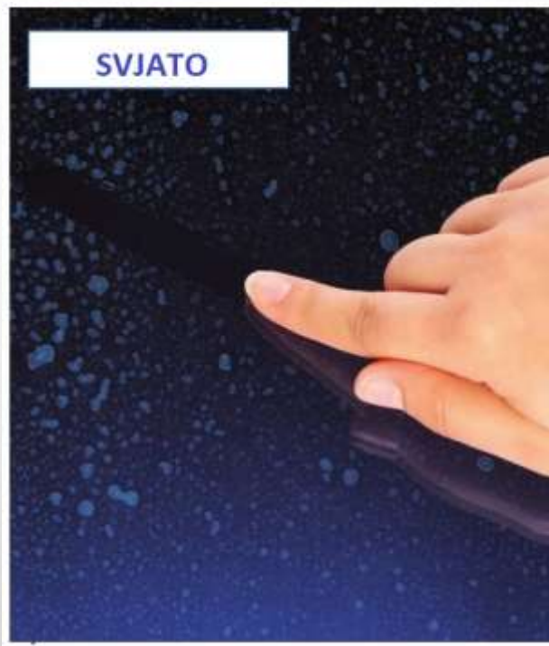
Мити скло легко.