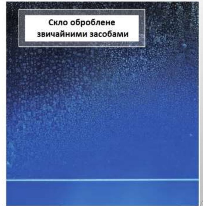
Досить суттєве забруднення.