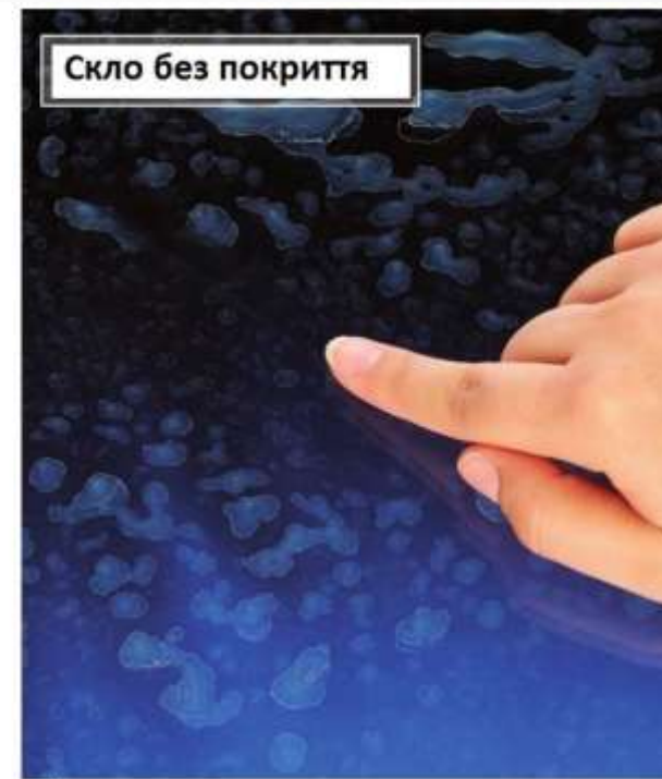
Мити скло важко.