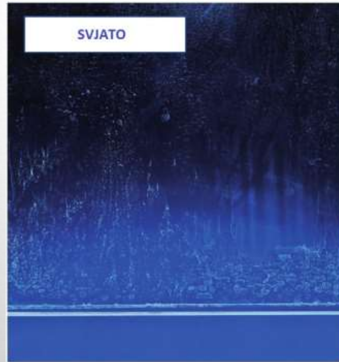
Не значний осад