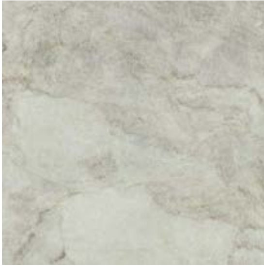
TAJ MAHAL POL RECT 120 X 120 / 48" X 48"

ROD. TAJ MAHAL POL. 75 X 60 / 3" X 24" K29/P