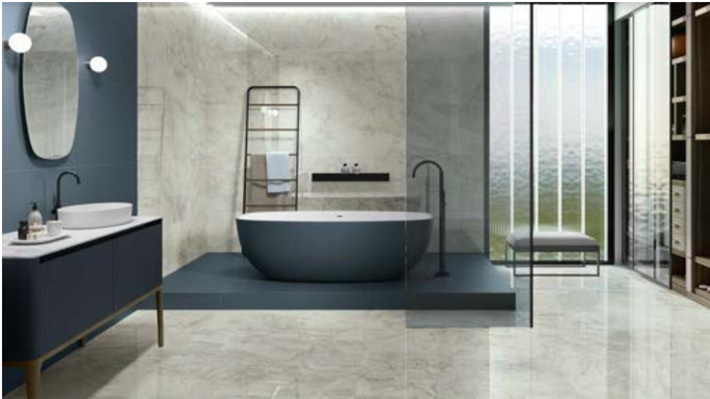
TAJ MAHAL POL RECT 60X120/TAJ MAHAL POL RECT 120X120/WOOD MATT RECT 60X120