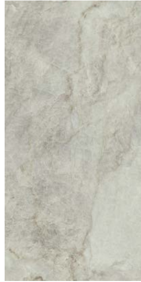
TAJ MAHAL MATT RECT 60 X 120 / 24" X 48" R60/M