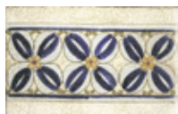
FRONTAL CORSIA PORC. 16 x 25 (G 12) 6" x 10" ♦