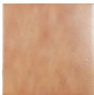
TERRACOTA ARESA 25 x 25 (G 24) 10" x 10" m 2