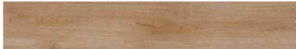
TIMELESS ROBLE 150x24,8