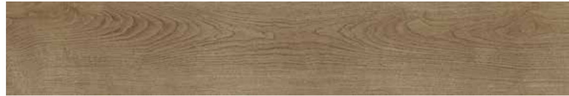
TIMELESS TITANIUM 150x24,8