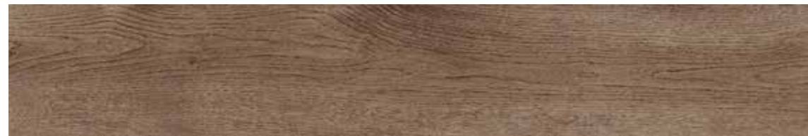
TIMELESS SIENA 150x24,8