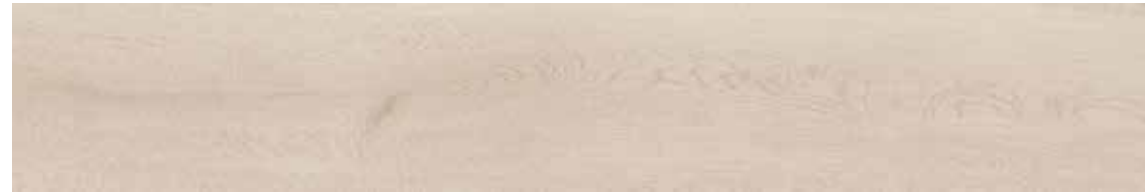
TIMELESS CREMA 150x24,8

Natural: Clase 1 / R9 / A Antislip Shoeless: Clase 3 / R10 / A+B