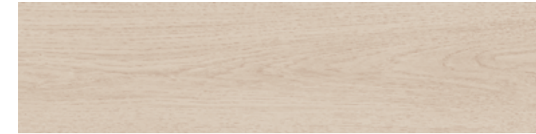
TIMELESS CREMA 100X24,8

COLOURED BODY PORCELAIN FLOOR TILES / PAVIMENTO PORCELÁNICO COLOREADO / GRÉS CÉRAME COLORÉ / DURCHGEFÄRBT FEINSTEINZEUGBODENFLIESEN