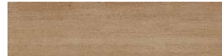
TIMELESS ROBLE 100X24,8