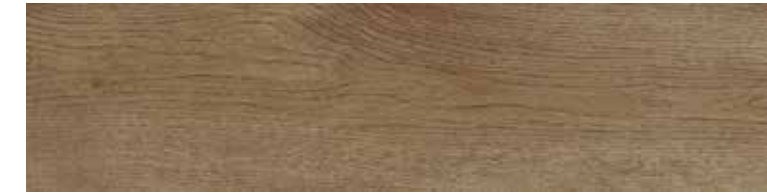
TIMELESS TITANIUM 100X24,8