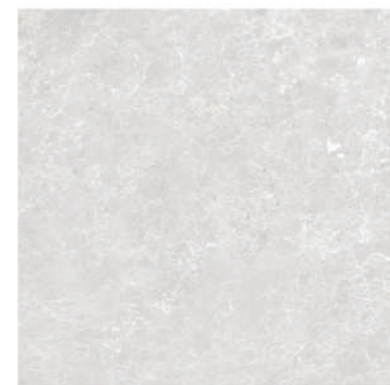
Pav. Torino 45 x 45 CM