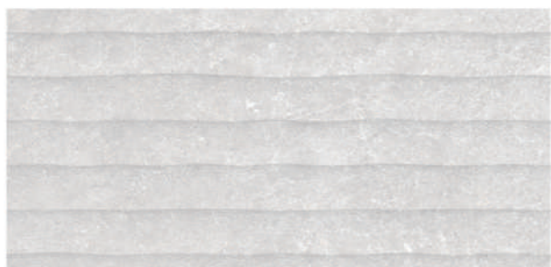
Breeze Torino Ivory 30 x 60 CM