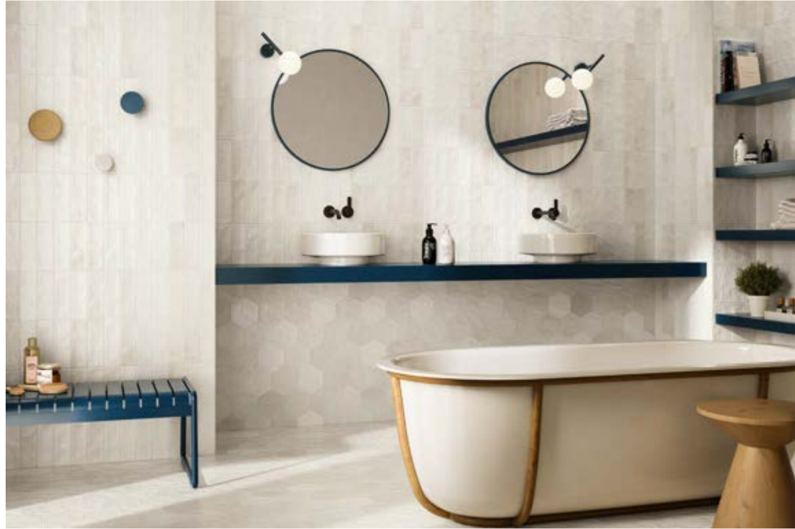
TOSCANA COTTON 6,5X20. HEXA TOSCANA COTTON 13X15.