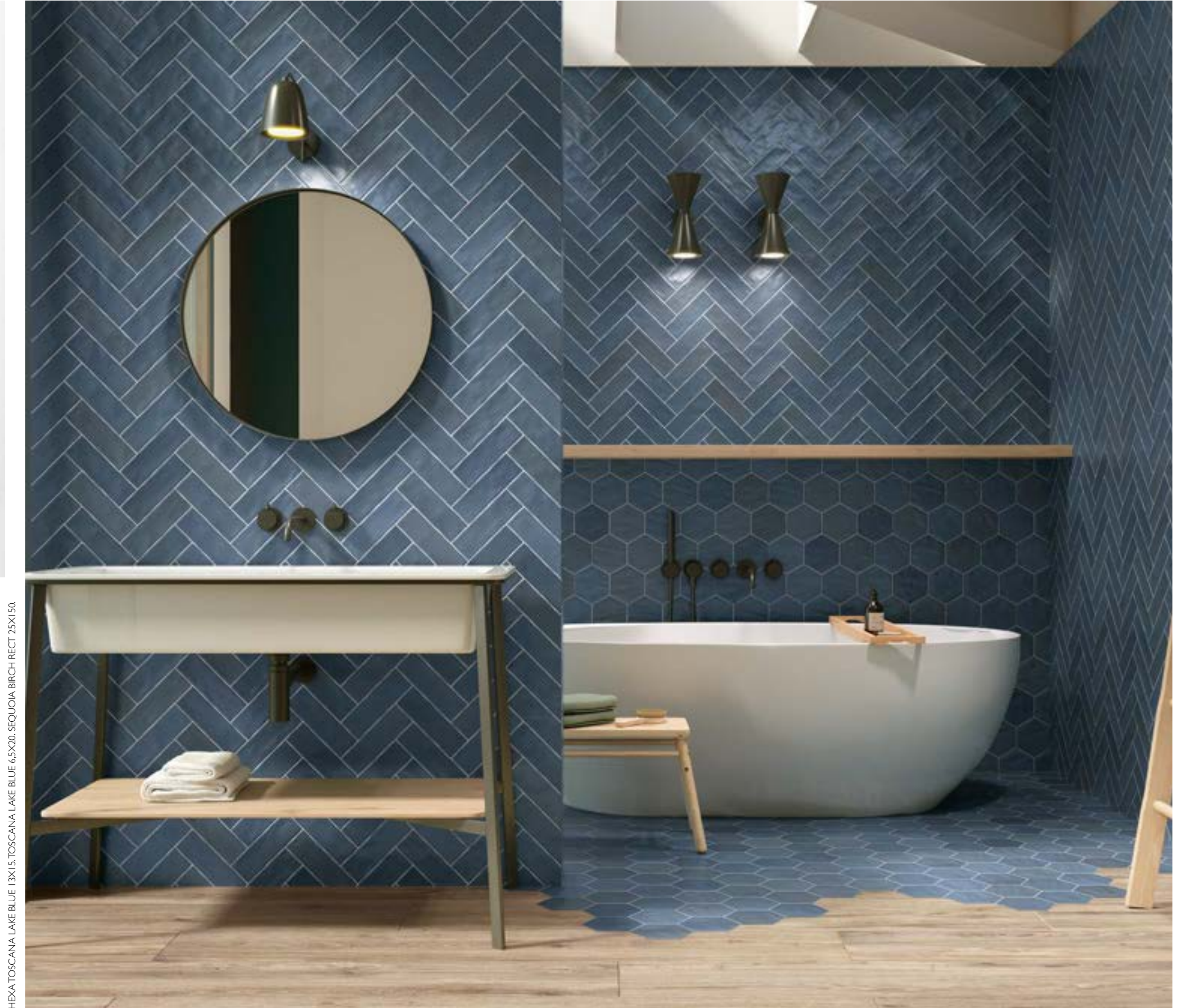
HEXA TOSCANA LAKE BLUE 13X15; TOSCANA LAKE BLUE 6,5X20; SEQUOIA BIRCH RECT 25X150.