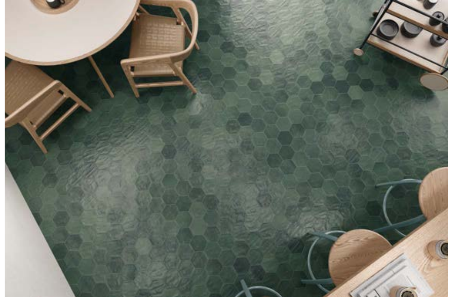
HEXA TOSCANA HERB 13X15. ILLINOIS WHITE RECT 60X120.