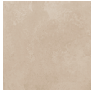
R54C Trace Beige rettificato 75x75