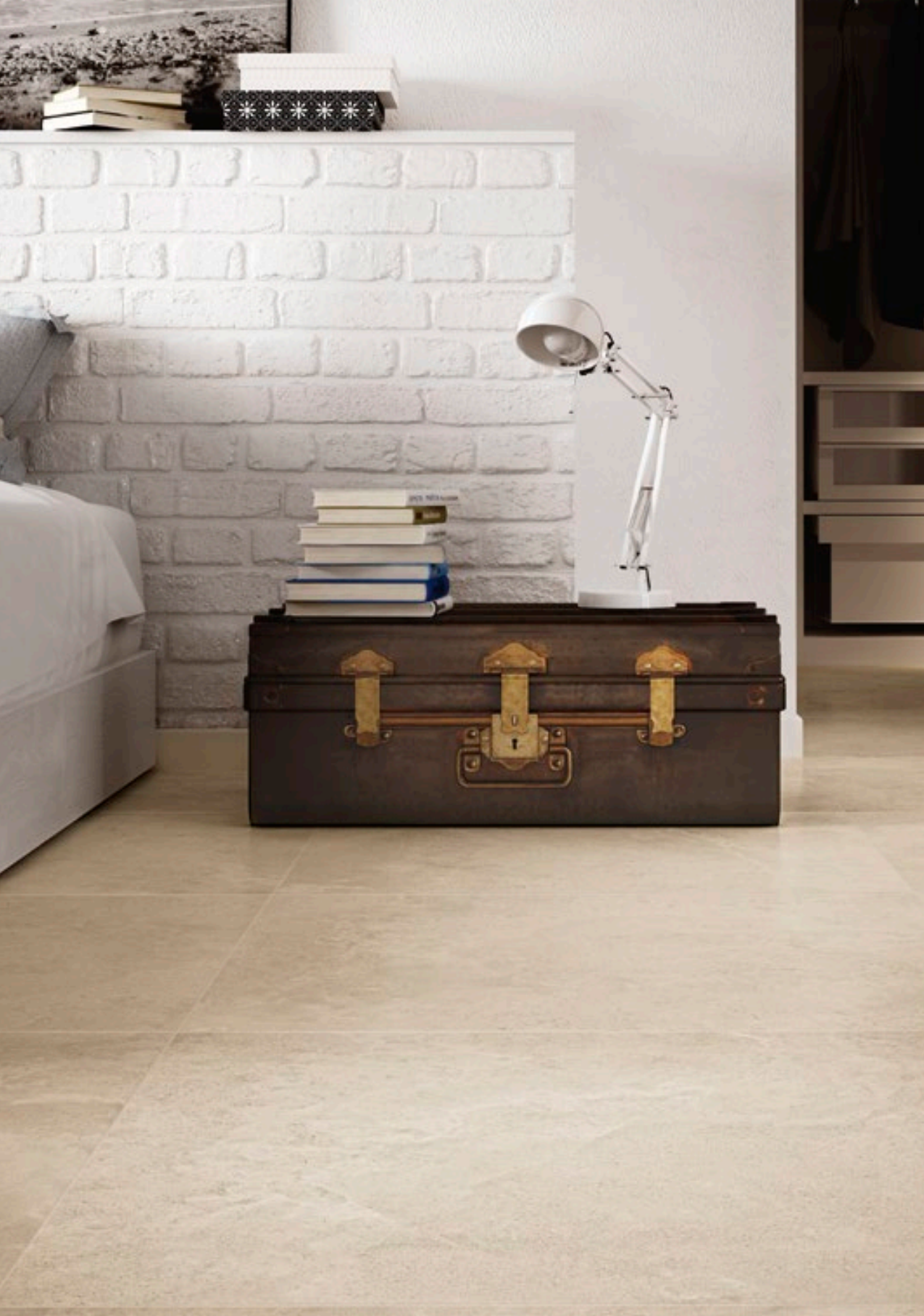
R54A Trace Ivory rettificato 75x75