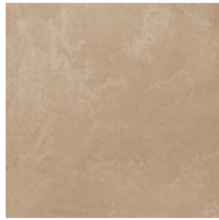
R54D Trace Nut rettificato 75x75