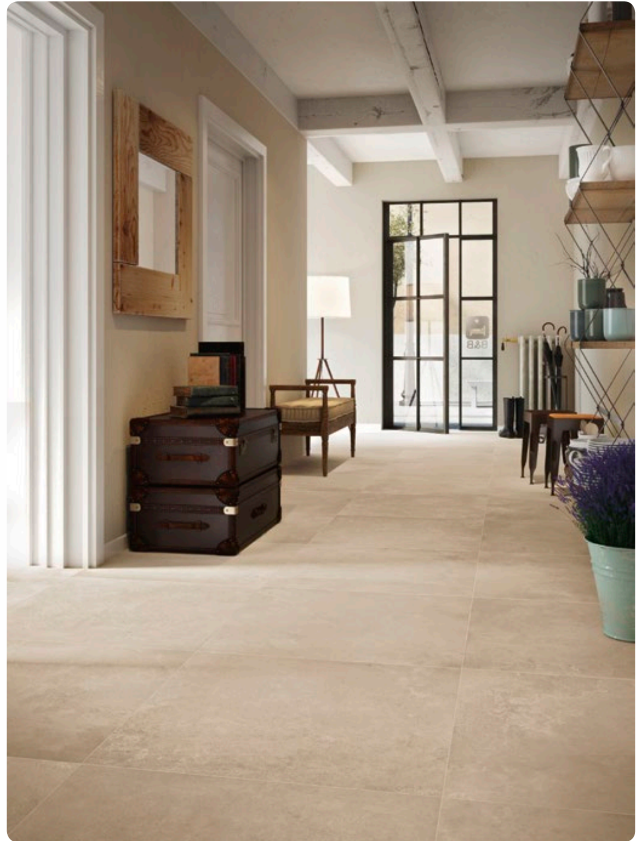
R54C Trace Beige rettificato 75x75