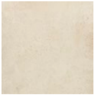
R54A Trace Ivory rettificato 75x75

gres fine porcellanato colorato in massa - rettificato monocalibro colorbody fine porcelain stoneware - rectified monocaliber durchgefärbtes feinsteinzeug - rektifiziert, in einem werkmaß grès cérame fin coloré dans la masse - rectifié monocalibre gres porcelánico fino coloreado en toda la masa - rectificado monocalibre гомогенный мелкозернистый керамогранит - ректифицированный монокалиберный