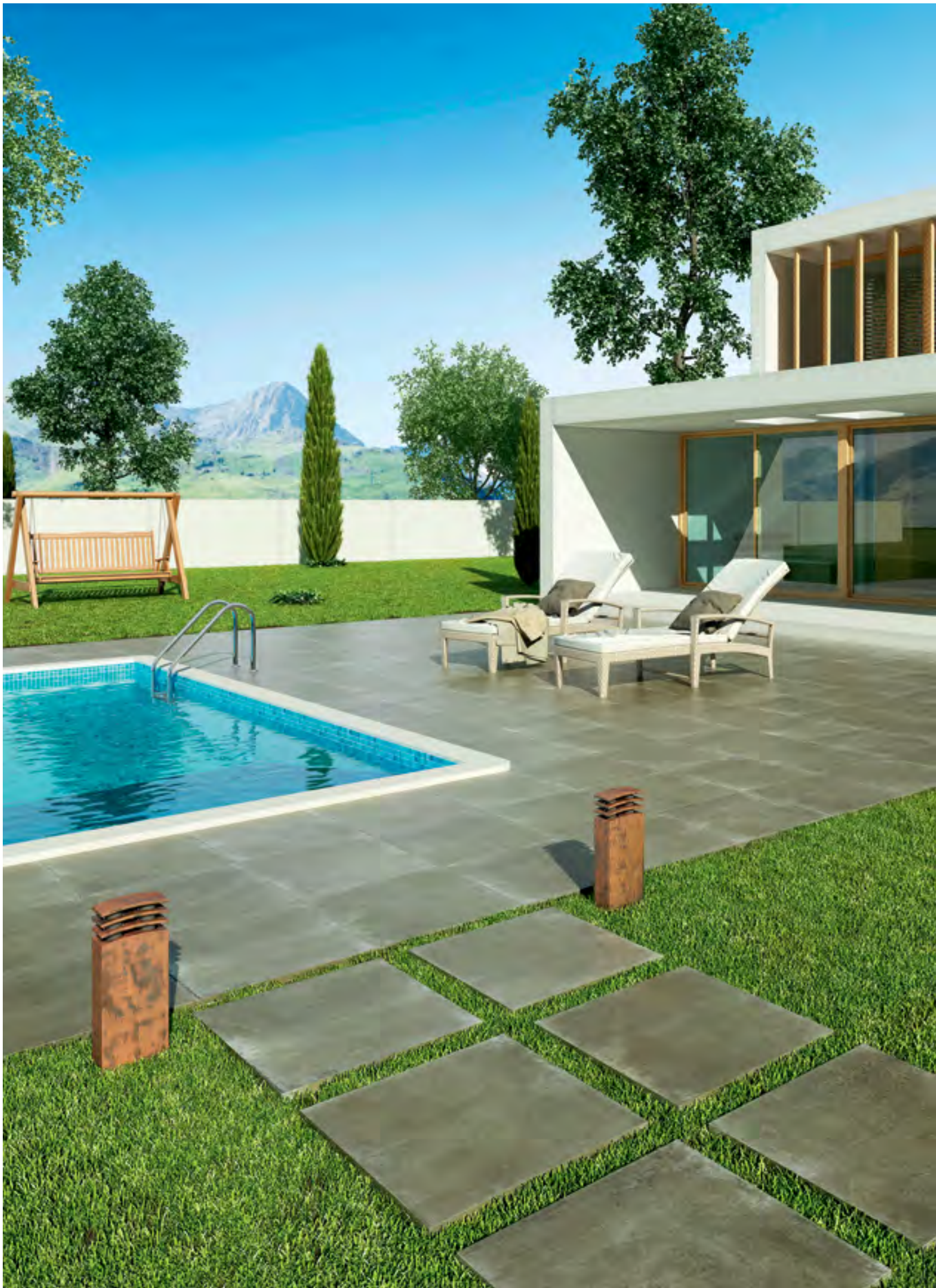
Ambiente Porc. Esm. Trend Plus Marengo 60 x 60 cm