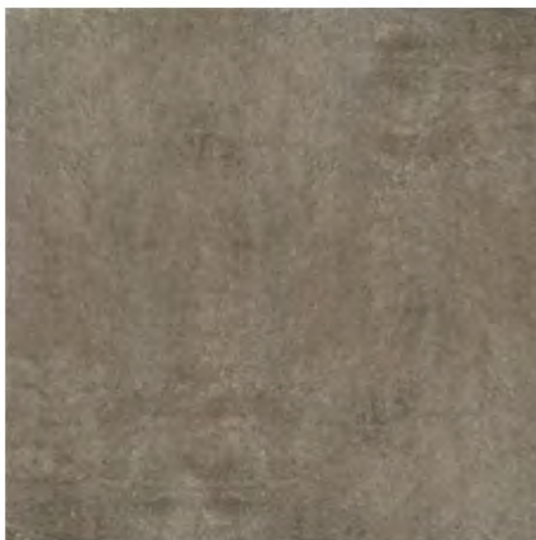
P.E. Plus Trend Taupe

Coefficiente de fricción dinámica Dynamic coefficient of friction (DCOF) > 0,42 ANSI137.1 : 2012