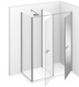
T14 L 155÷165 P 70÷99 h 195