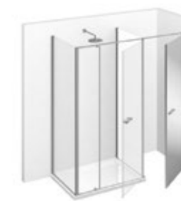
T44 L 160÷190 P 70÷99 h 195