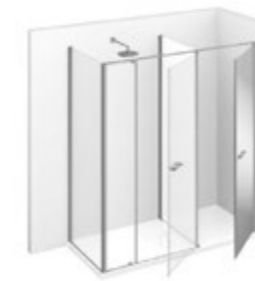
T24 L 160÷190 P 70÷99 h 195

Il piatto doccia può essere più elevato rispetto al vano tecnico