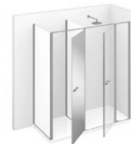
T22 L 160÷190 P 70÷99 h 195