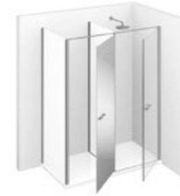
T12 L 155÷165 P 70÷99 h 195