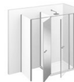
T42 L 160÷190 P 70÷99 h 195