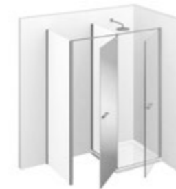
T32 L 155÷165 P 70÷99 h 195