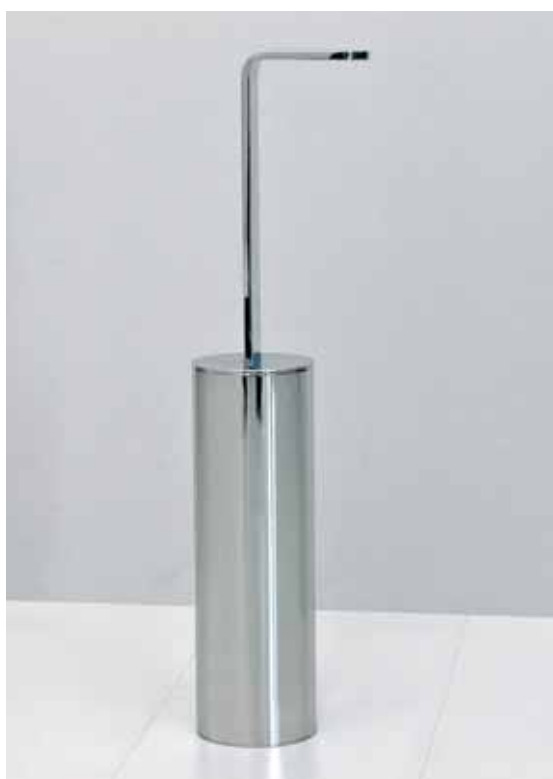
Two art. TWOPF