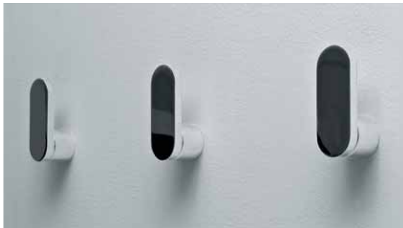
Two art. TWOPA