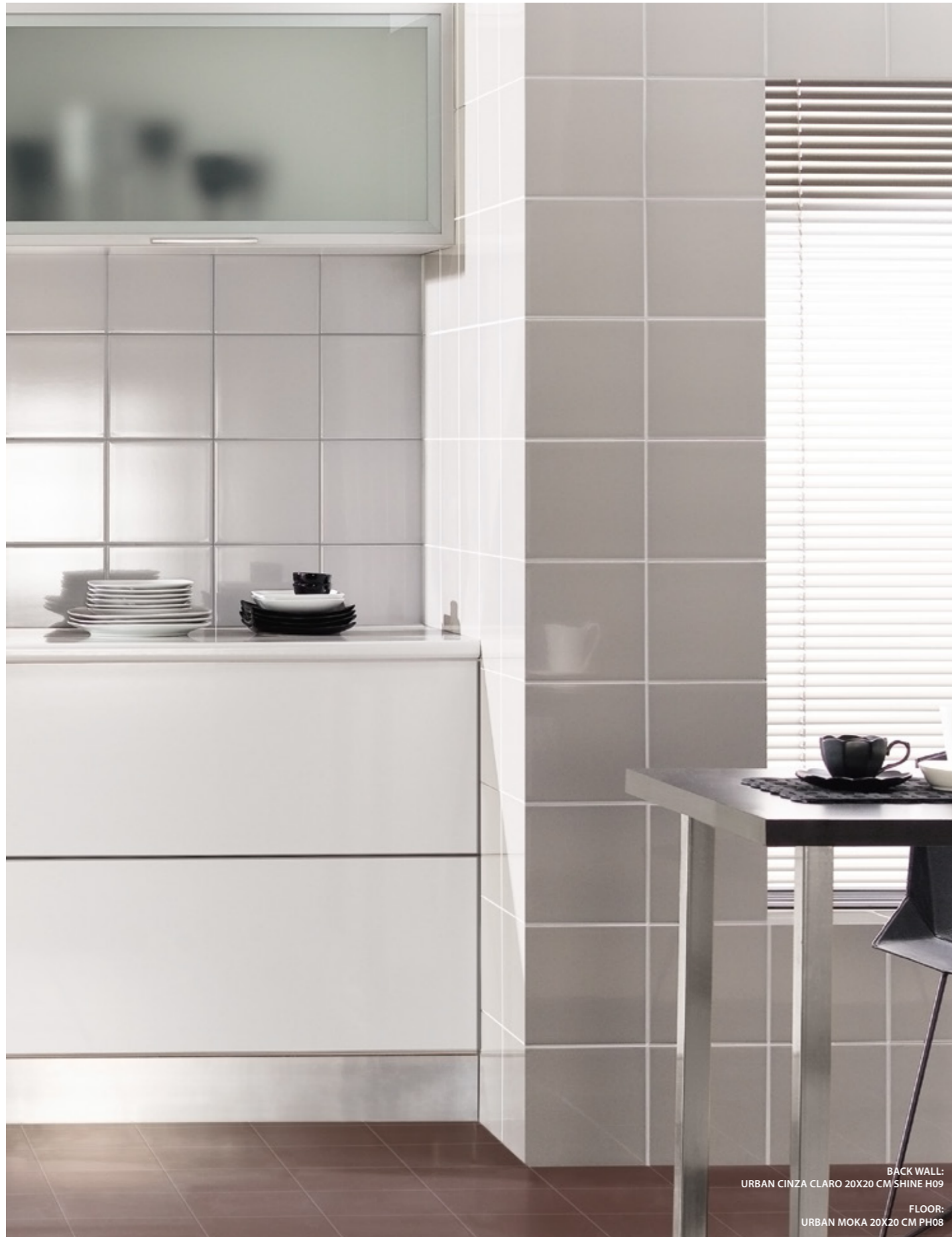
BACK WALL: URBAN CINZA CLARO 20X20 CM SHINE H09