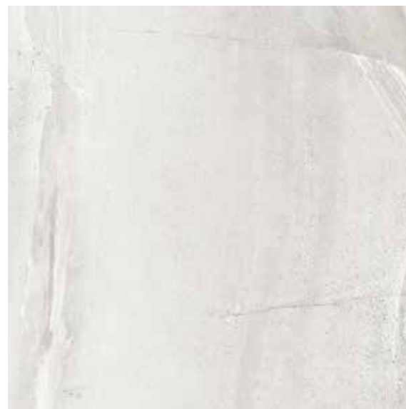
VELVET BLANCO** 75x75 REC. ☒ 75x75 REC. NPLUS.