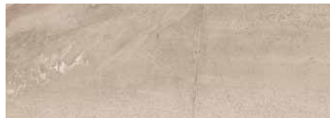
VELVET NATURAL** 29x84 REC. x1 29x84 REC. NPLUS.