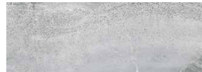
VELVET GRIS** 29x84 REC. ☒ 29x84 REC. NPLUS.