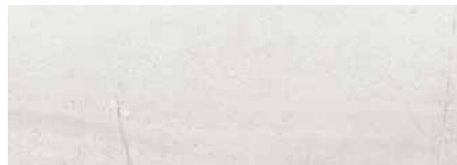
VELVET BLANCO** 29x84 REC. ☒ 29x84 REC. NPLUS.