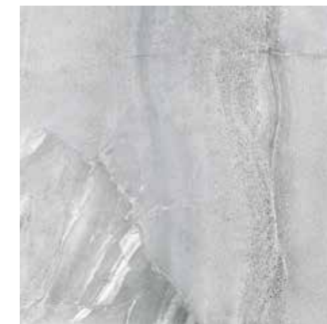
VELVET GRIS** 59x59 REC. ☒ 59x59 REC. NPLUS.