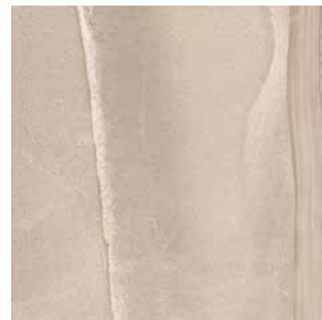
VELVET NATURAL** 59x59 REC. x1 59x59 REC. NPLUS.