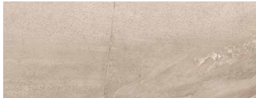
VELVET NATURAL** 45x118 REC. x1 45x118 REC. NPLUS.