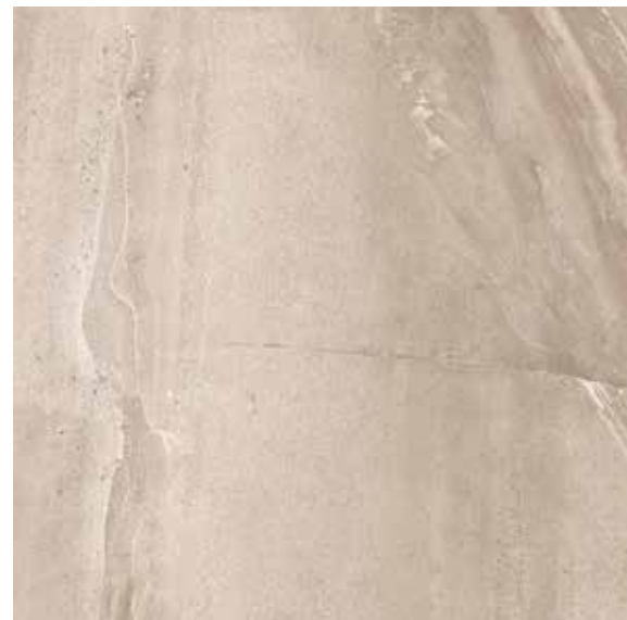
VELVET NATURAL** 75x75 REC. x1 75x75 REC. NPLUS.