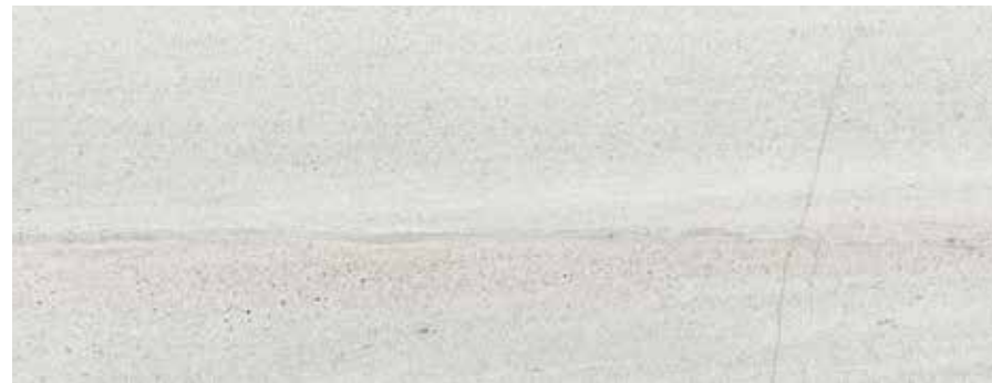
VELVET BLANCO** 45x118 REC. ☒ 45x118 REC. NPLUS.