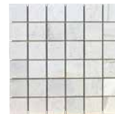
MOSAICO VELVET BLANCO 30x30 REC. ☒ G042 5 30x30 REC. NPLUS. G043 5