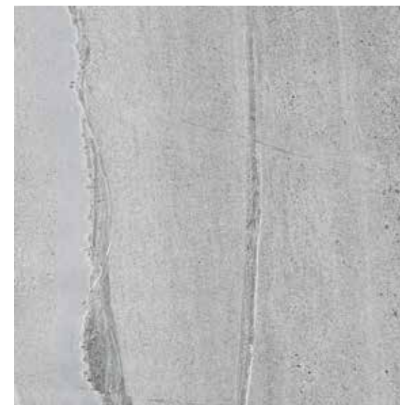
VELVET GRIS** 75x75 REC. ☒ 75x75 REC. NPLUS.