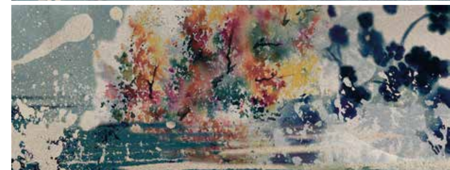
DECOR VELVET NATURAL * 45x118 REC. 29x84 REC.