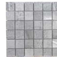
MOSAICO VELVET GRIS 30x30 REC. ☒ G042 5 30x30 REC. NPLUS. G043 5