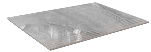
PELDAÑO VELVET NATURAL* 37x75 REC. ☒ 37x75 REC. NPLUS. 29x84 REC. ☒ 29x84 REC. NPLUS. 29x59 REC. ☒ 29x59 REC. NPLUS. 45x118 REC. ☒ 45x118 REC. NPLUS.

G053 4 G057 4 G053 4 G057 4 G052 4 G057 4 G069 2 G071 2