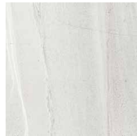
VELVET BLANCO** 59x59 REC. ☒ 59x59 REC. NPLUS.