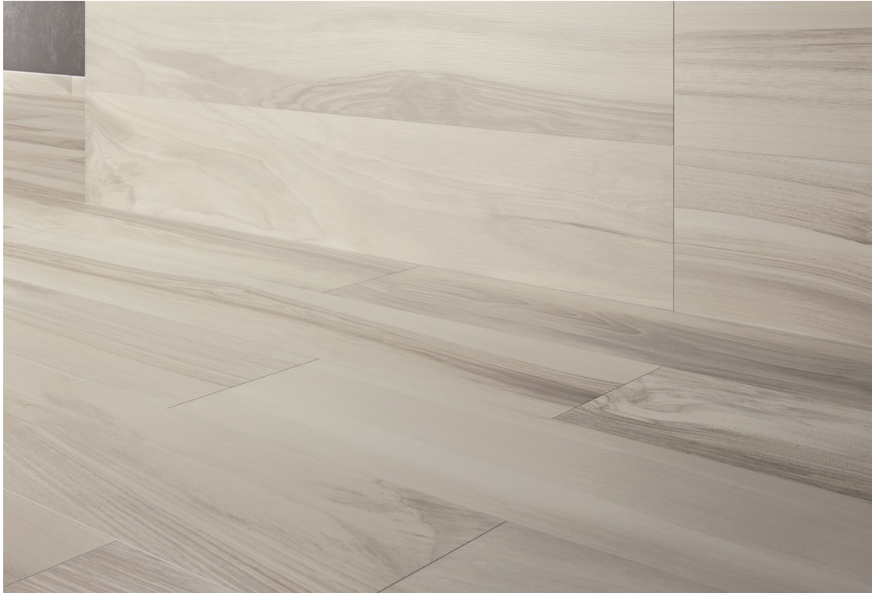
Tabula XL Bianco 20x120 - 7,9"x47,2"