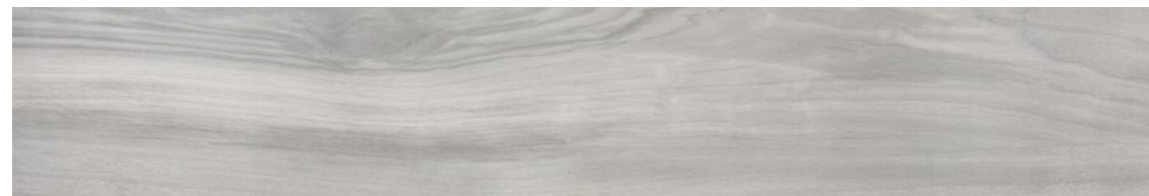
G0011A TABULA XL GRIGIO 20x120 - 7,9"x47,2"