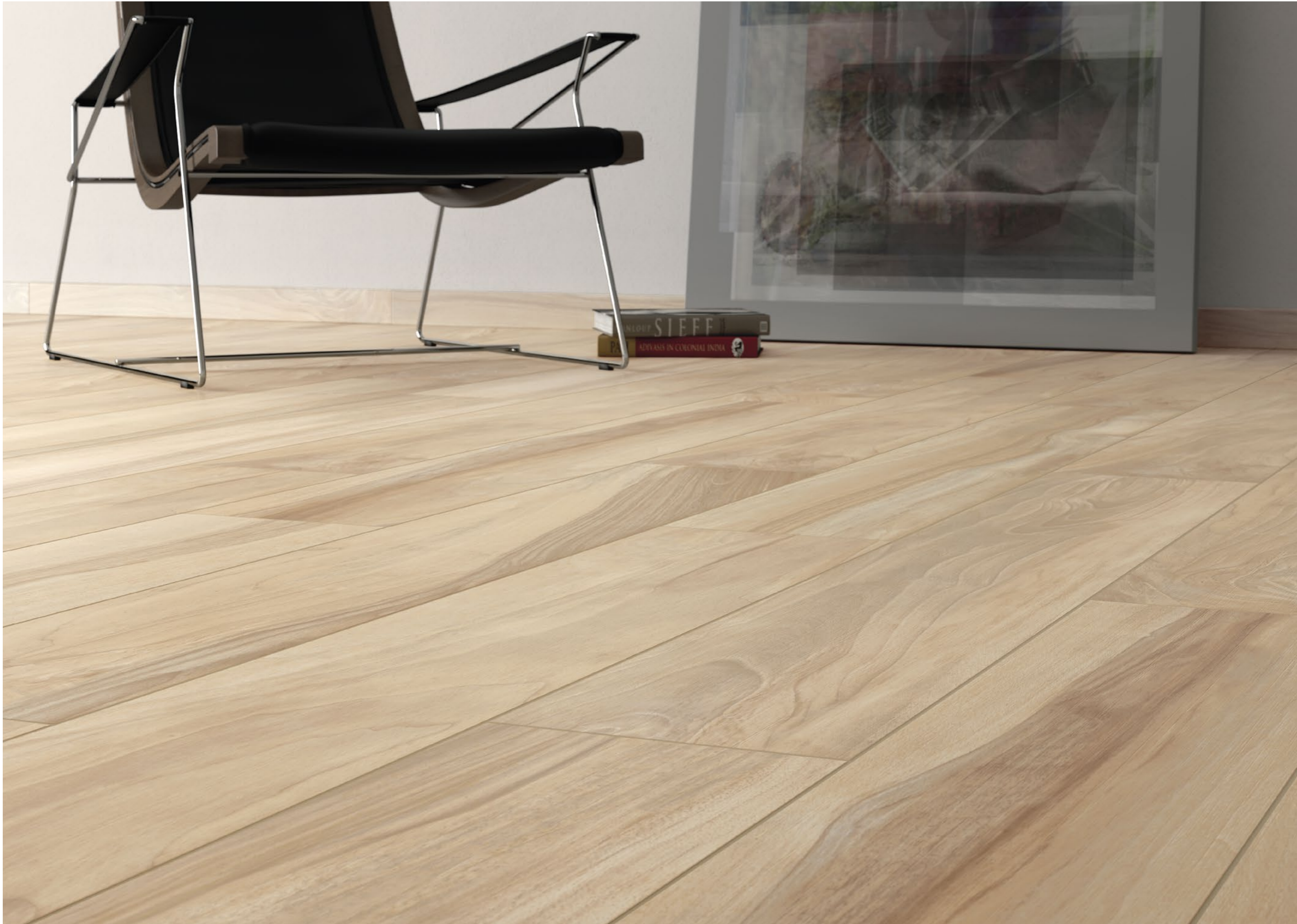
Tabula XL Miele 20x120 - 7,9"x47,2"