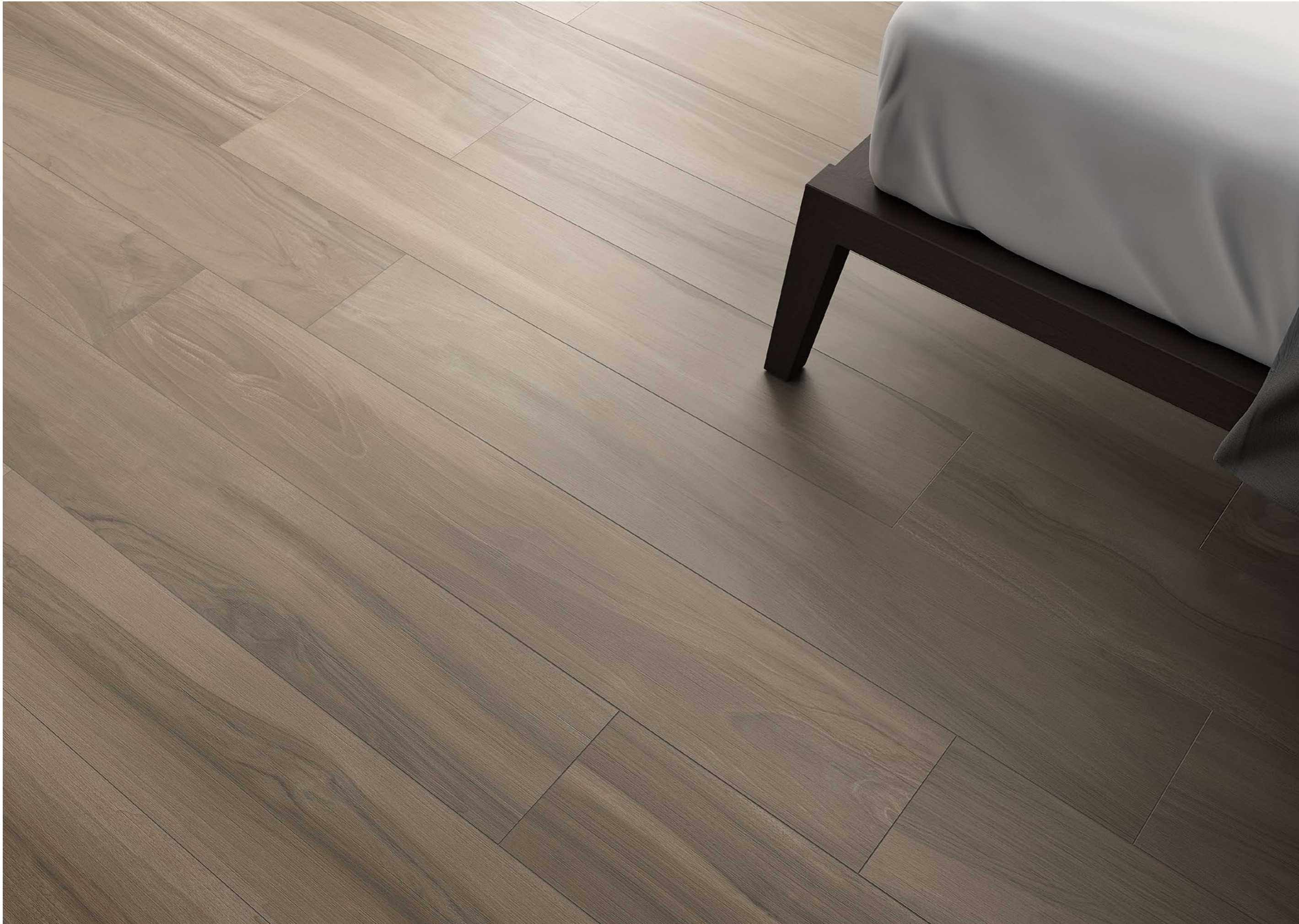
Tabula XL Cenere 20x120 - 7,9"x47,2"