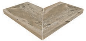
CARTABÓN EXTERIOR PELDAÑO RECTO EVO VO-570382 625 x 625 x 40