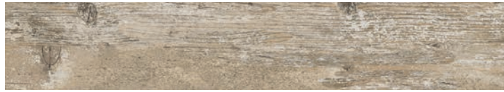
BASE 1200 VO-596381 1200 x 200 x 11