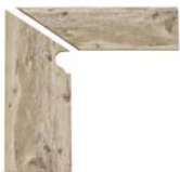
ZANQUÍN FIORENTINO XL VO -594382 Drcho. VO -595382 Izdo. 288 x 270 x 86