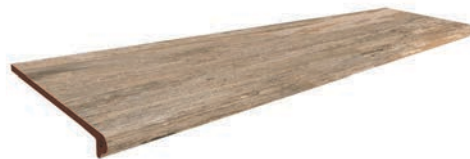
PELDAÑO FIORENTINO XL VO-566382 1200 x 330 x 40