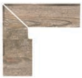
ZANQUÍN RECTO EVO CORTE VO-152382 Drcho. VO-153382 Izdo. 305 x 270 x 86