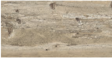
BASE VO-550381 625 x 310 x 10