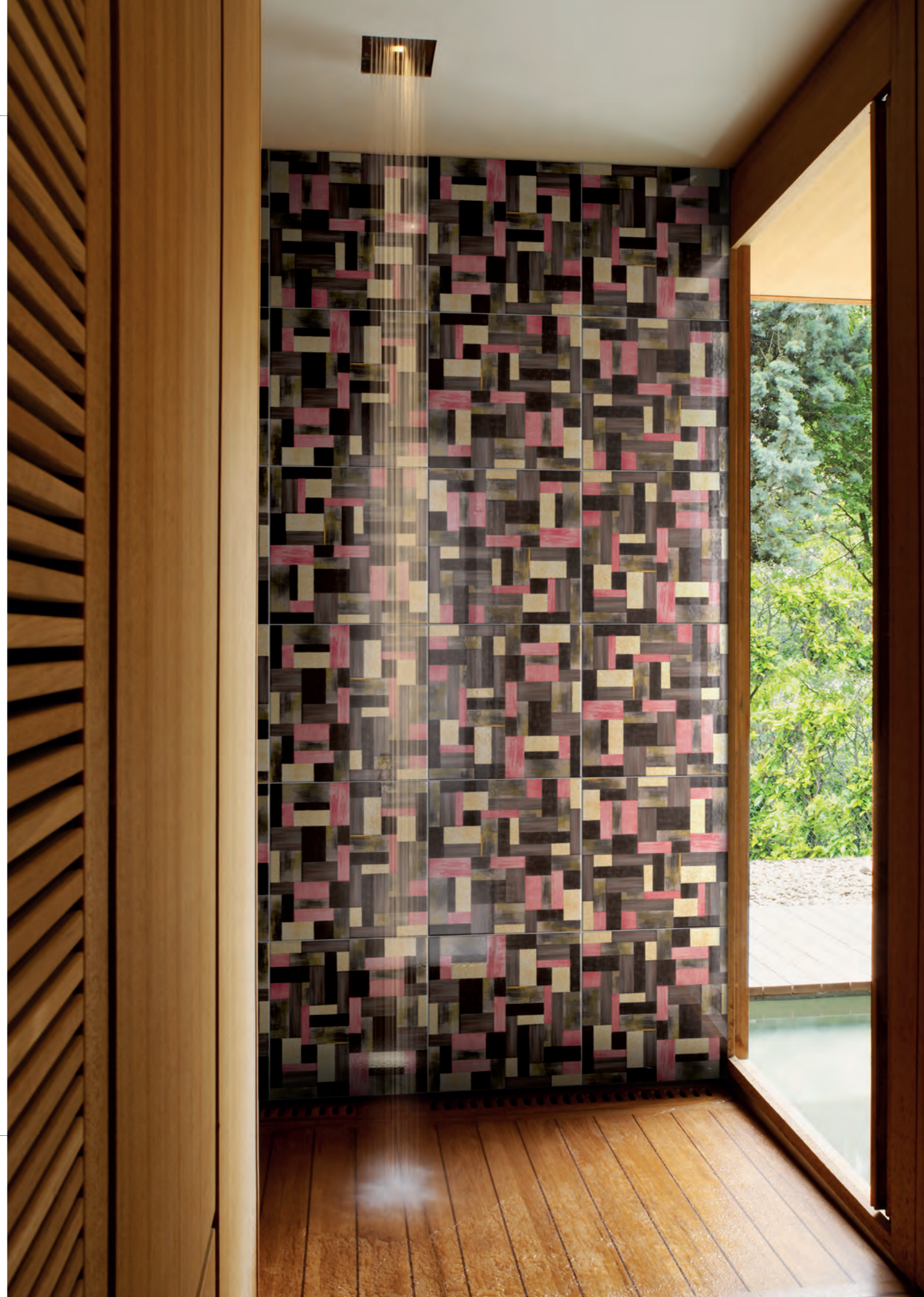
Pagina / Page 87 BAGNO / BATHROOM , rivestimento / coating WALLPAPER D1 (cm. 40x40 - 16"x16")