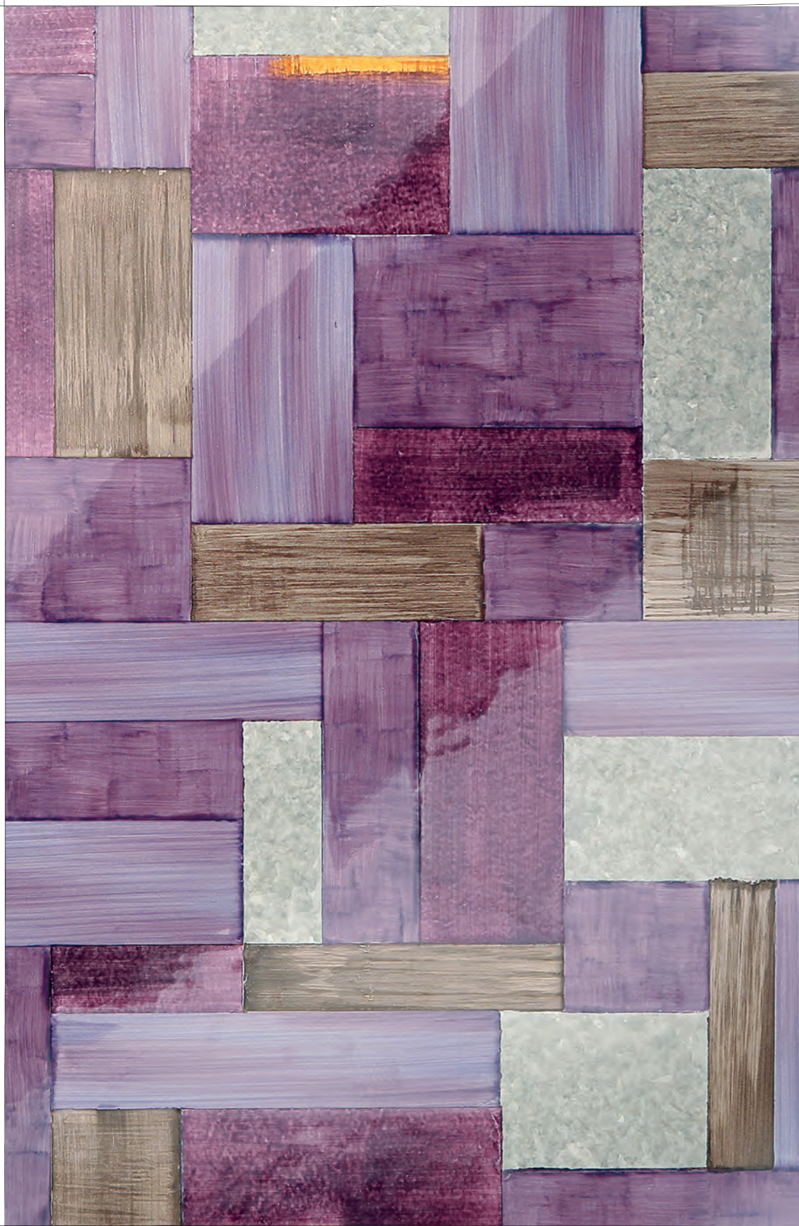
DETTAGLIO / DETAIL, WALLPAPER C4