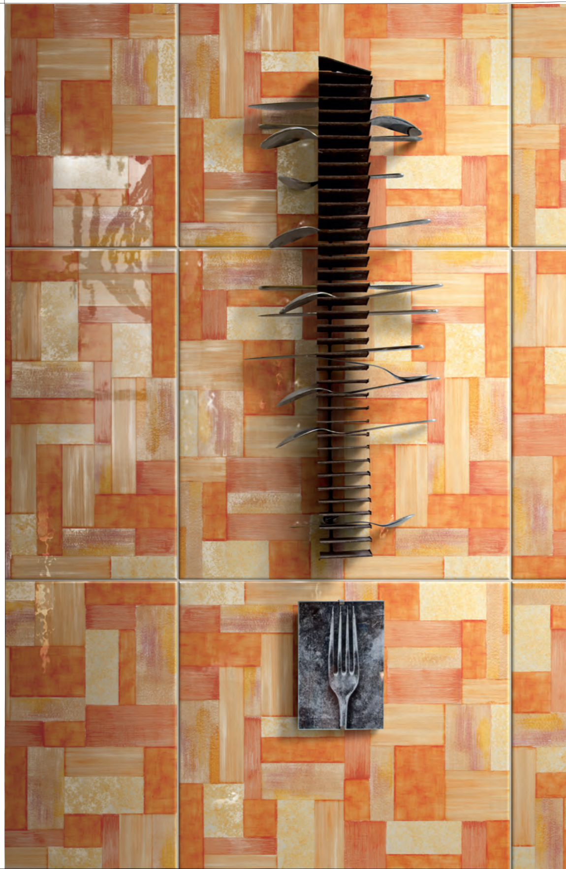
Pagina / Page 84-85 BAGNO / BATHROOM , pavimento / flooring WALLPAPER C6 (cm. 40x40 - 16"x16")