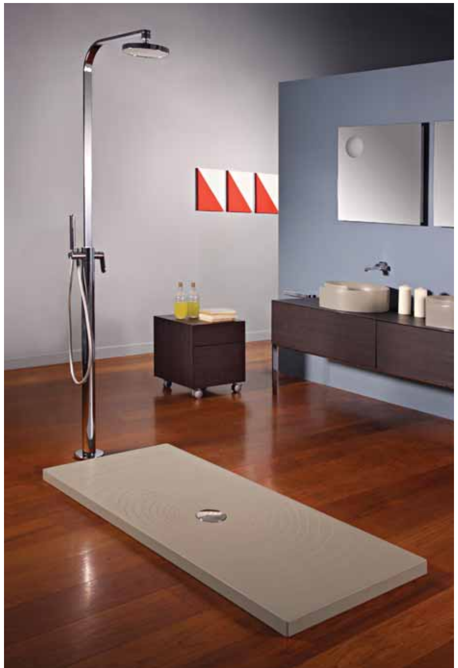
Water Drop _ Argilla art. DR7016 - 160 x 70 x h 5,5 cm