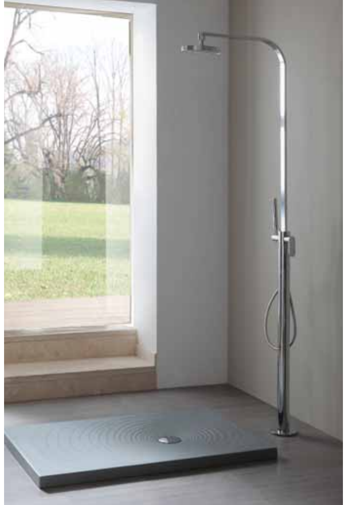
Water Drop _ Grigio Lava art. DR120 - 120 x 80 x h 5,5 cm