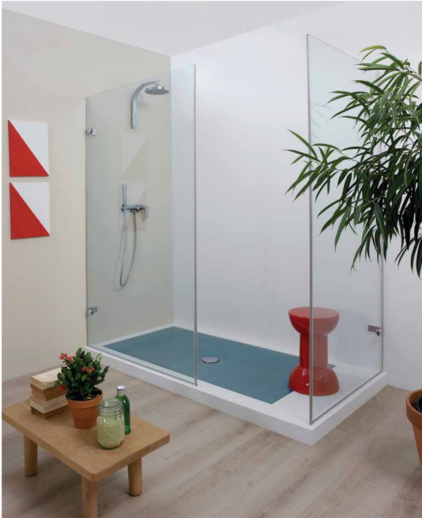
Water Drop _ Nuvola art. DR8016 - 160 x 80 x h 5,5 cm