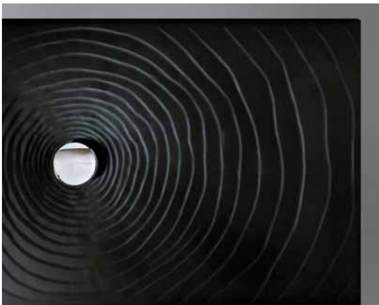
Water Drop _ Carbone art. DR140 - 140 x 80 x h 5,5 cm