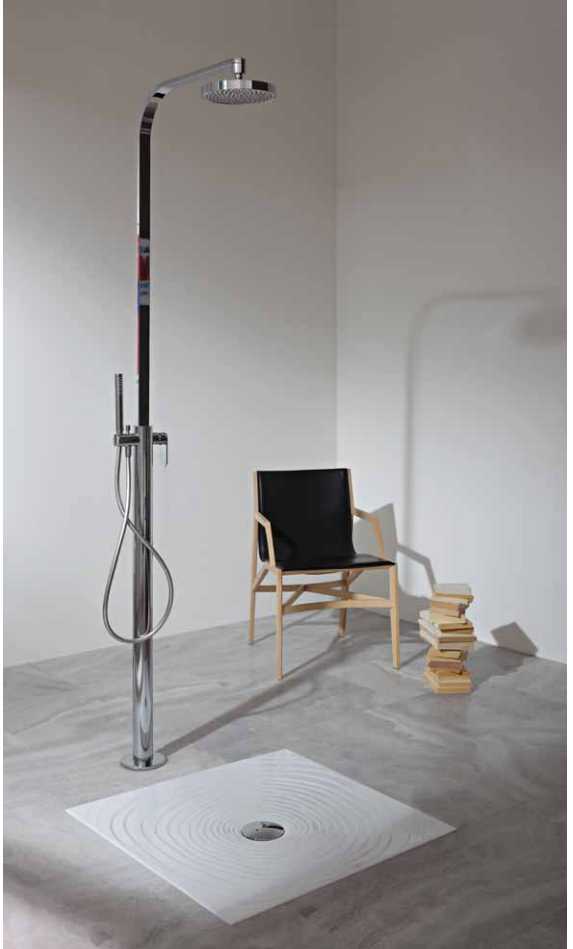
Water Drop art. DR80 - 80 x 80 x h 5,5 cm