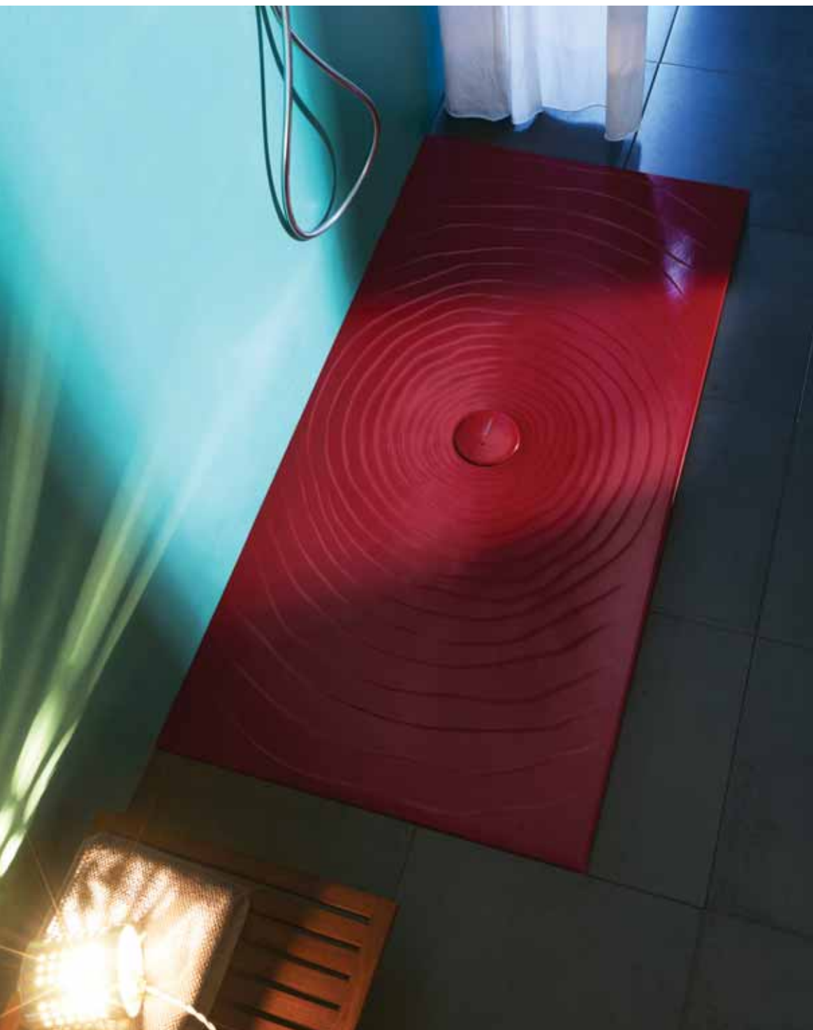
Water Drop _ Rosso Rubens art. DR70 - 140 x 70 x h 5,5 cm