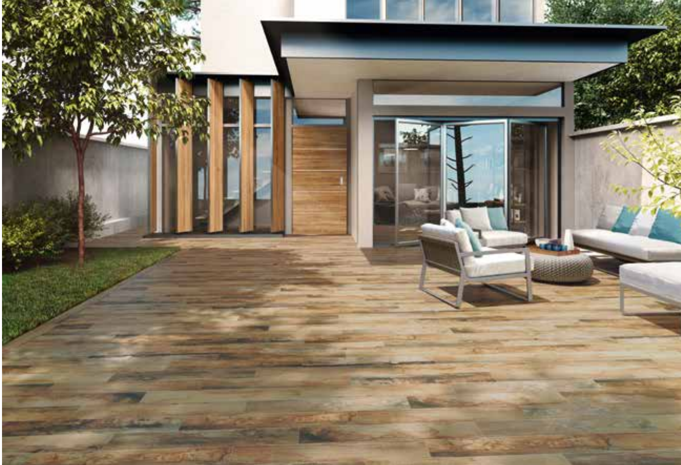
WONDERWOOD NATURAL 15X90