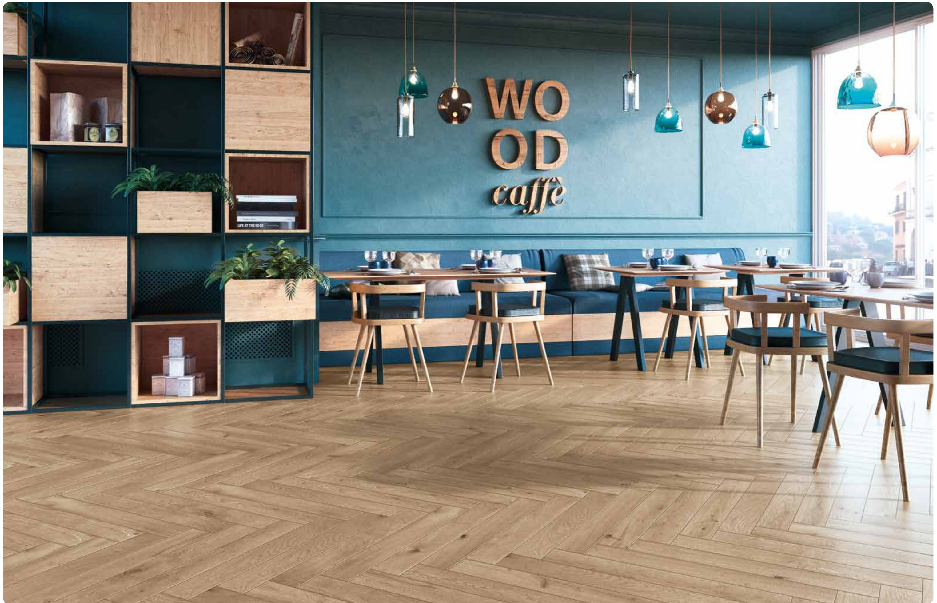
R4MC Woodessence Beige 10x70