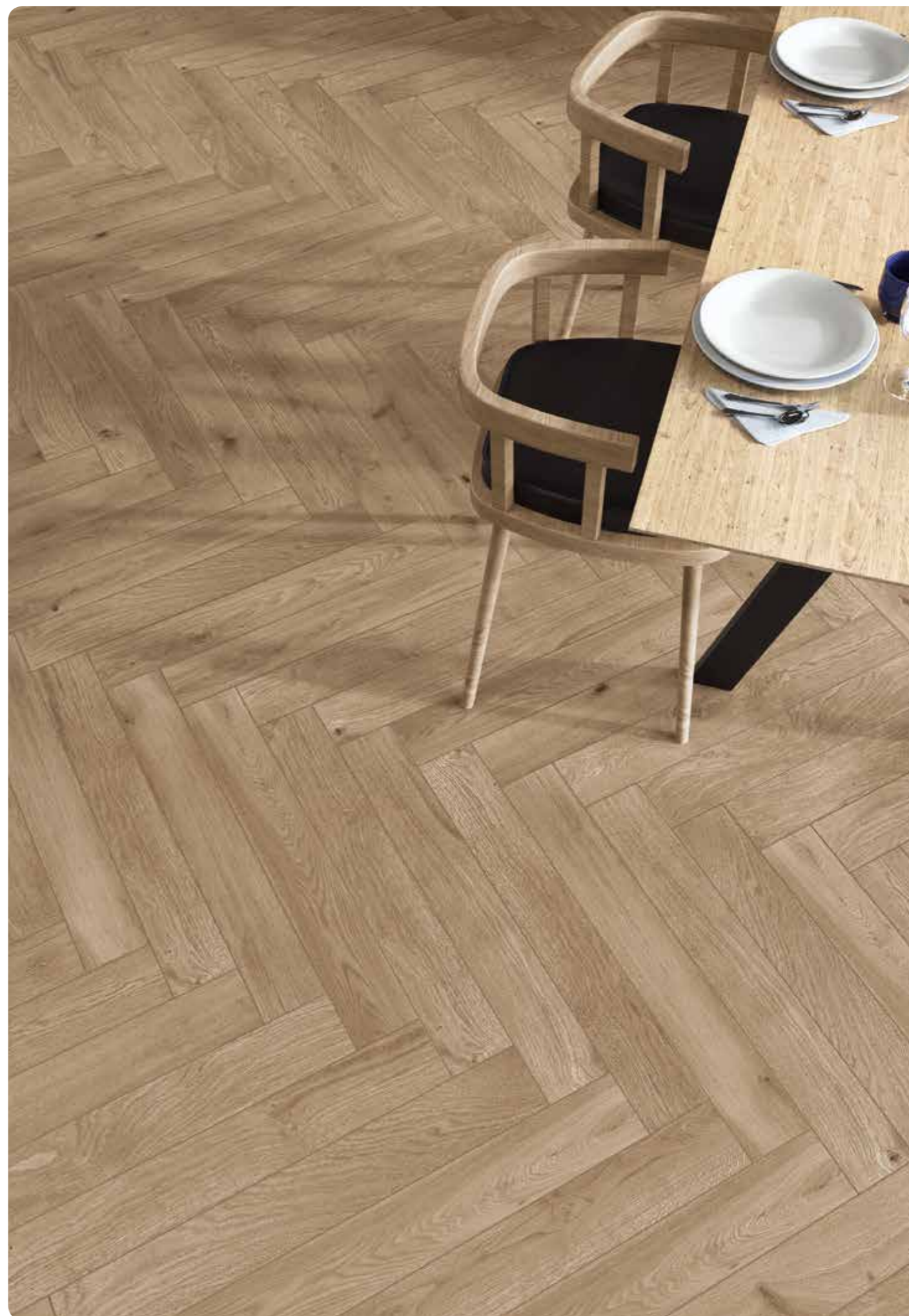
R4MG Woodessence Walnut 10x70