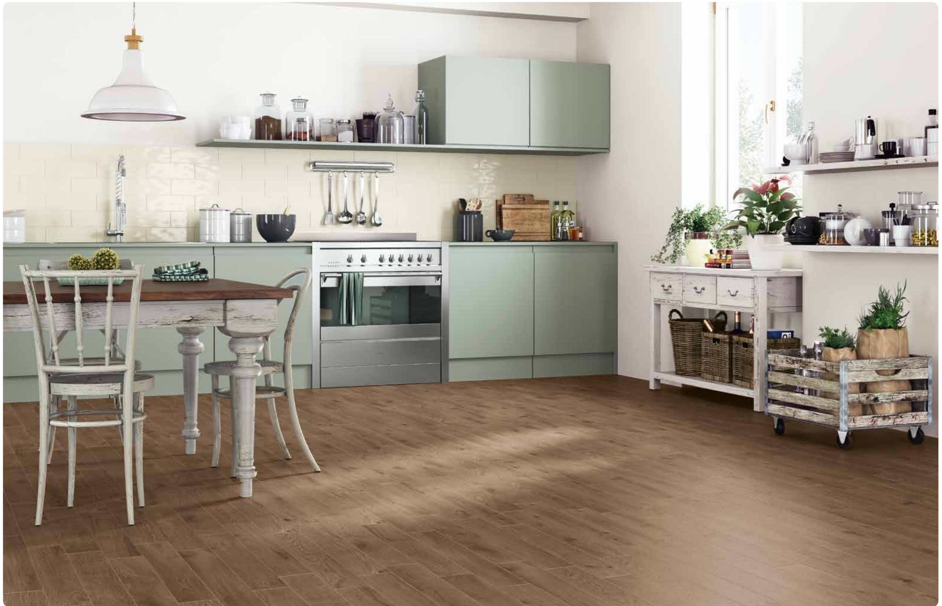
R4ME Woodessence Brown 10x70