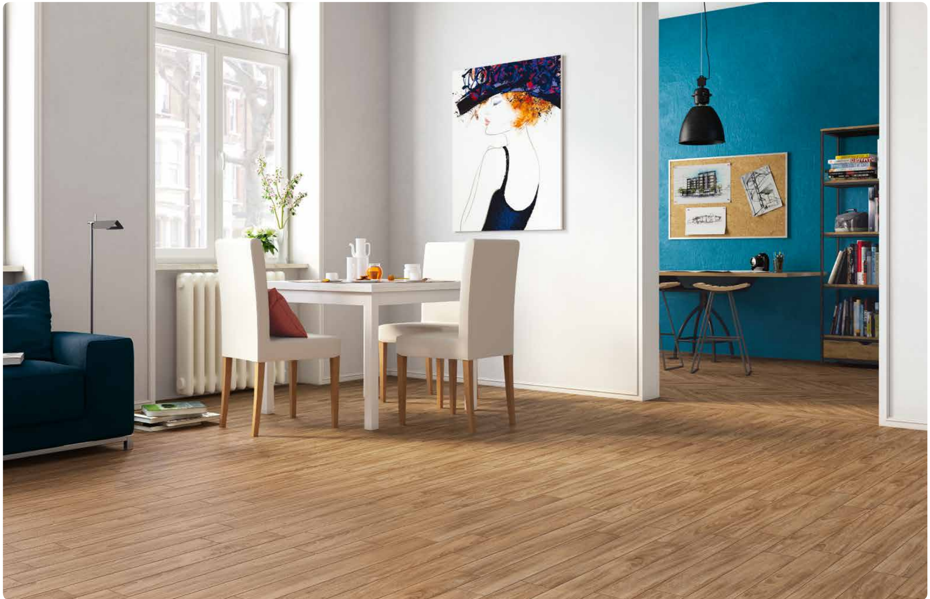
R4MF Woodessence Honey 10x70