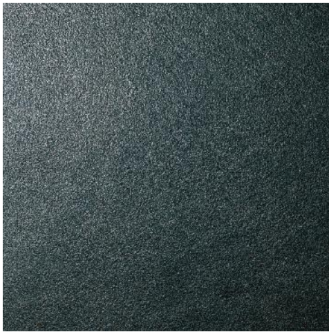
DP604700R Аннапурна черный обрезной 60x60 Annapurna black rectified