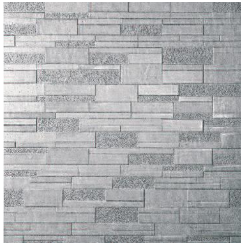
SG613802R Аннапурна серый лаппатированный 60x60 Annapurna grey lappato