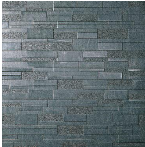
DP605202R Аннапурна черный лаппатированный 60x60 Annapurna black lappato