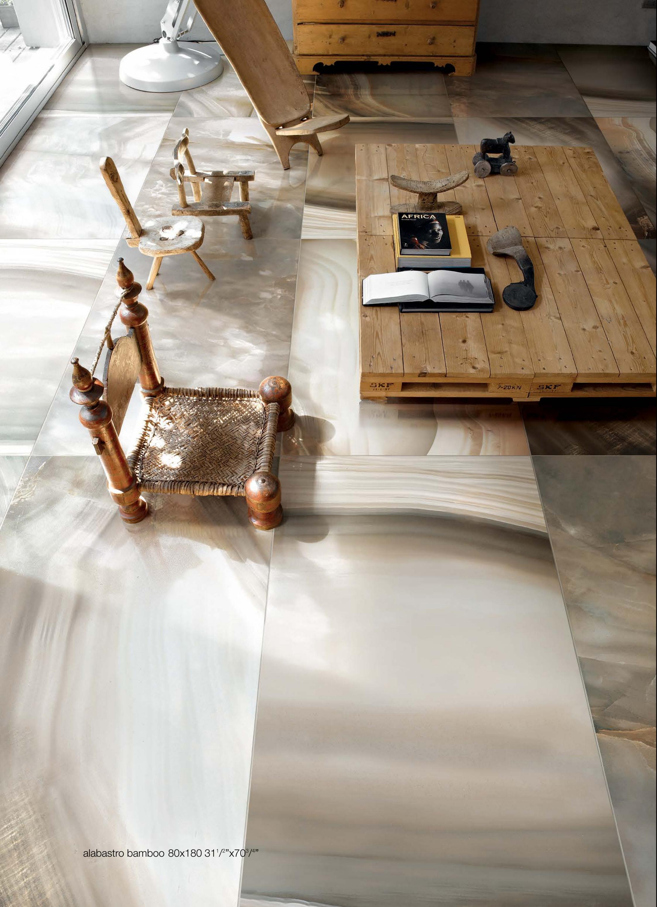
alabastro bamboo 80x180 31 1 / 2 "x70 3 / 4 "