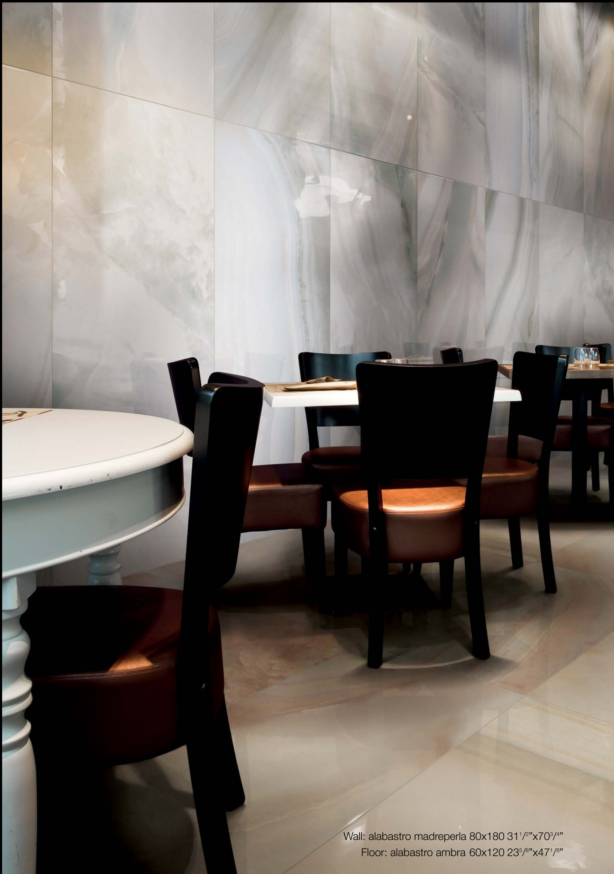
Wall: alabastro madreperla 80x180 31 1 / 2 "x70 3 / 4 " Floor: alabastro ambra 60x120 23 5 / 8 "x47 1 / 8 "