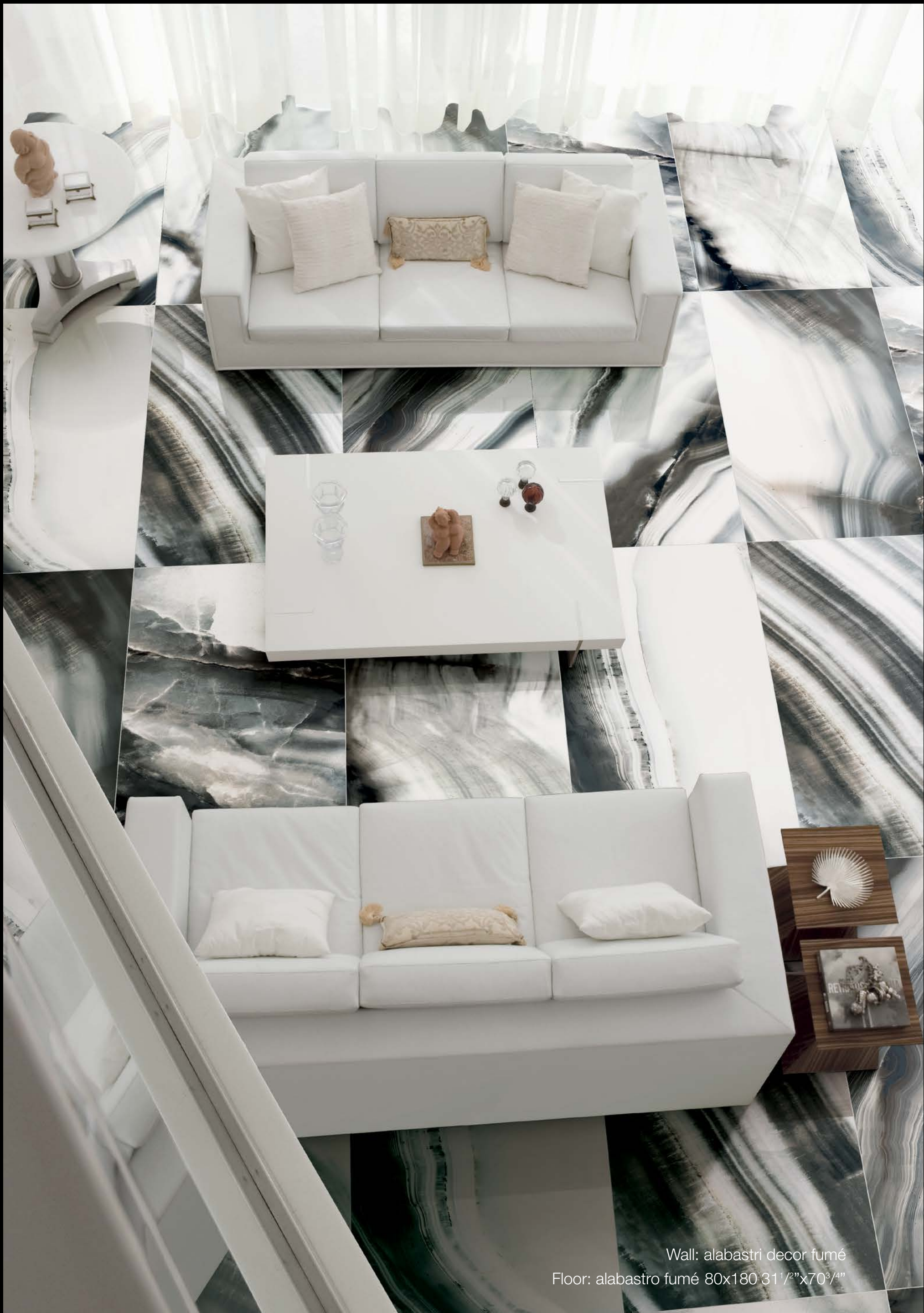
Wall: alabastru decor fumé