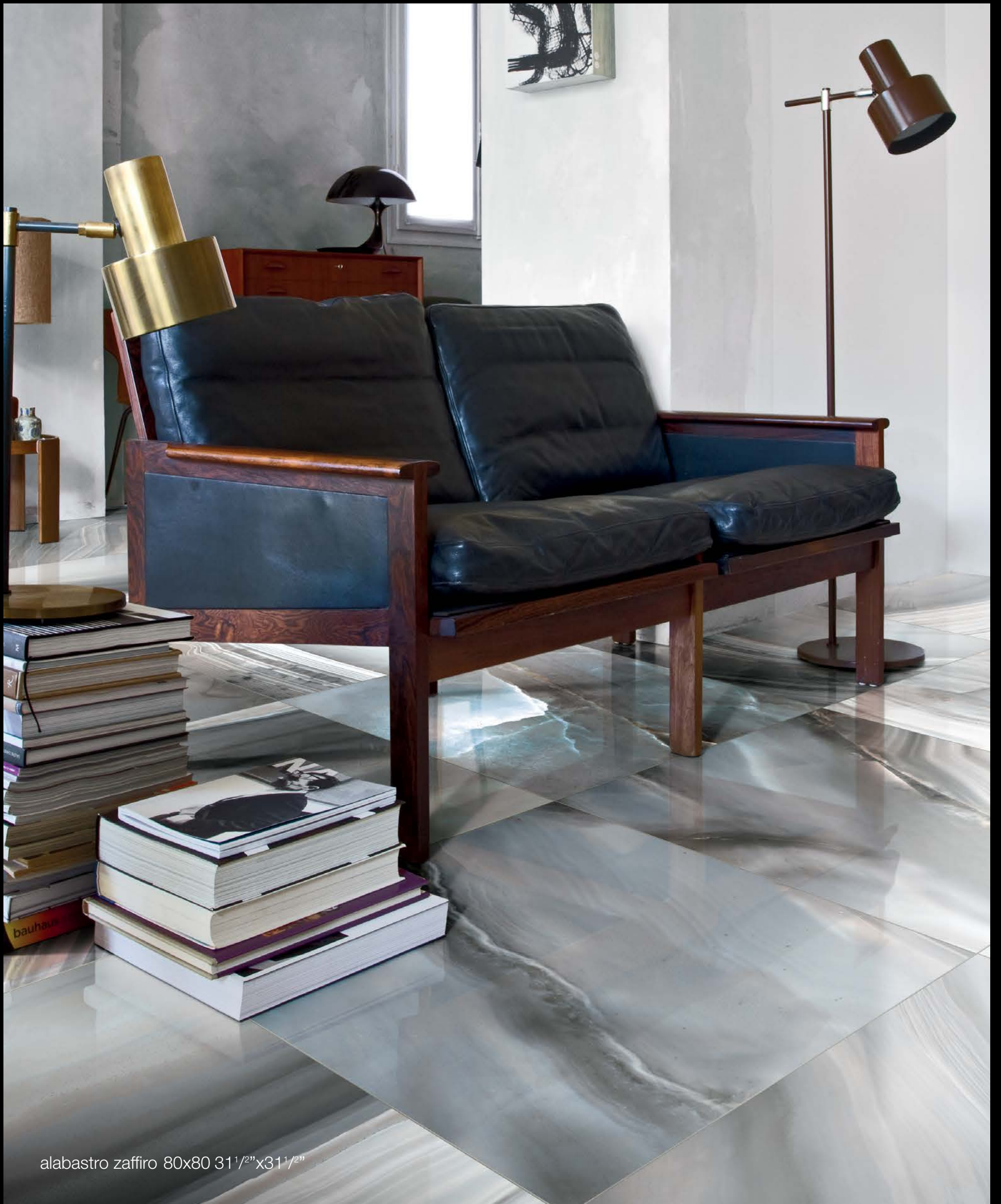
alabastro zaffiro 80x80 31 1 / 2 "x31 1 / 2 "