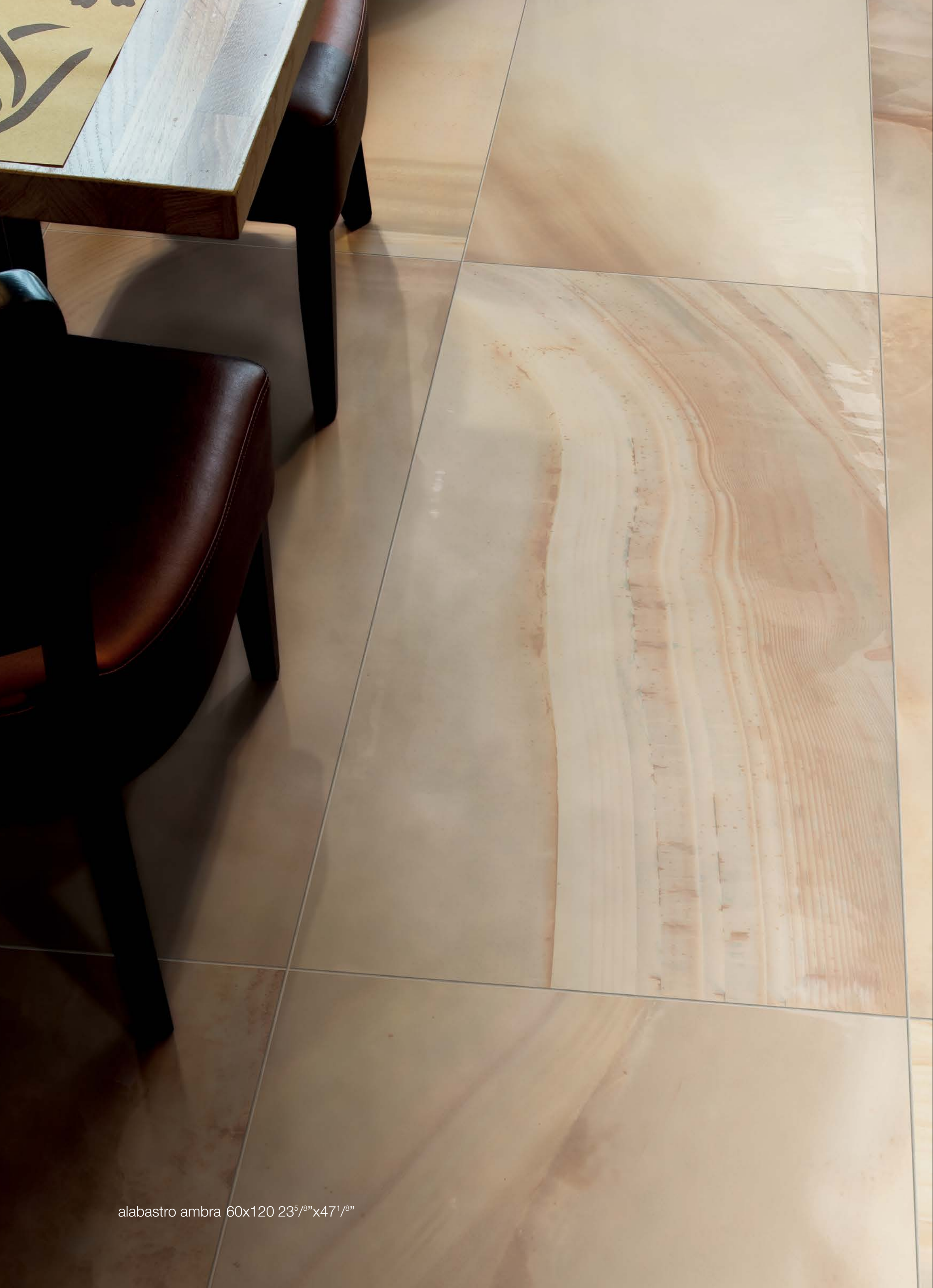
alabastro ambra 60x120 23 5 / 8 "x47 1 / 8 "