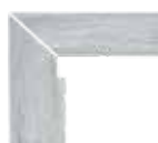
ZANQUÍN RECTO CORTE Dcho. YU-1521282 Izq. YU-1531282 305 x 270 x 86