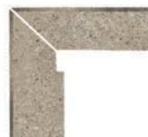
ZANQUÍN RECTO EVO CORTE ZA-152812 Drcho. ZA-153812 Izdo. 305 x 270 x 86