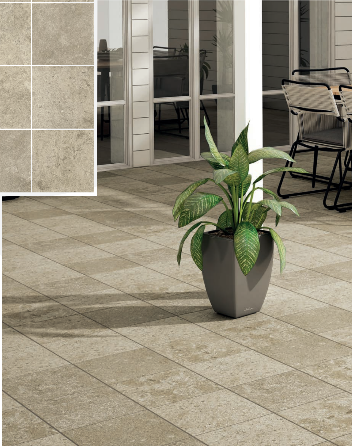
ZARAUZ. BASE 310 x 310.