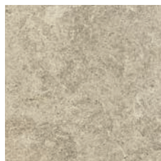
BASE ZA-555811 310 x 310 x 10