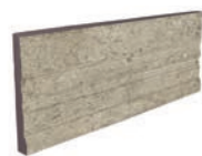
TABICA DOMUS G3 ZA-0870AP3 310 x 150 x 20