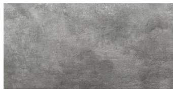
ZERMATT BASE GRIS