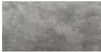
ZERMATT BASE GRIS