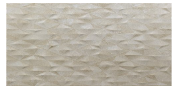
ZERMATT DECOR BEIGE