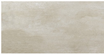
ZERMATT BASE BEIGE